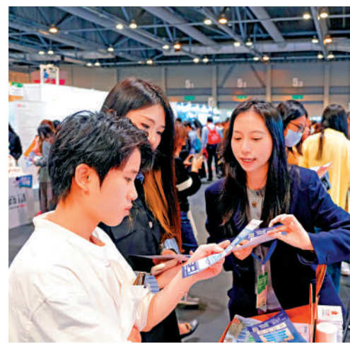
▶大公文匯傳媒集團的攤位，吸引許多有志從事新聞行業的年輕人前來應徵。