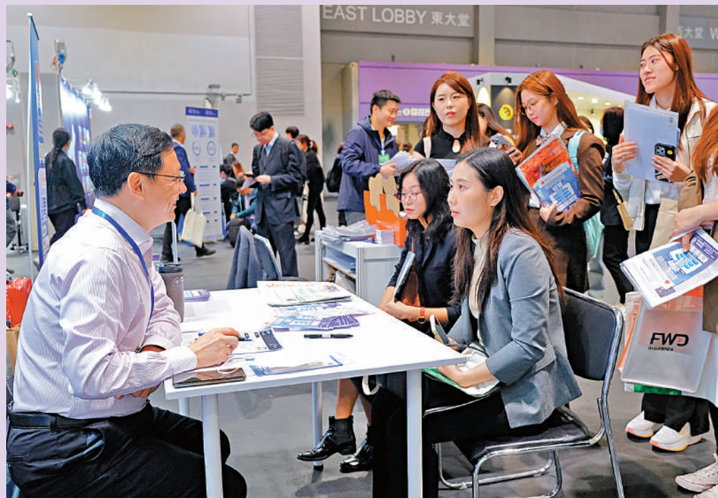
▲大文集團特邀資深傳媒人到場，與應聘者進行面對面交流暢談、即問即答。

香港拚經濟、謀發展，各界出盡法寶搶人才。「創新香港——國際人才嘉年華2024」昨日起一連兩日在亞博館舉行，逾200間企業提供職位，職位包括管理、互聯網、金融等行業，預計兩天可吸引逾兩萬人次入場。有求職者表示，看好香港市場就業前景，認為有較大發展空間，有意長期留港發展，累積更多工作經驗。