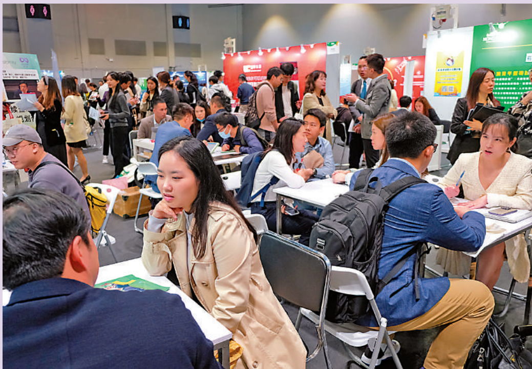
▲「創新香港——國際人才嘉年華2024」昨日起一連兩日在亞博館舉行，逾200企業提供職位，吸引大批求職者到場。