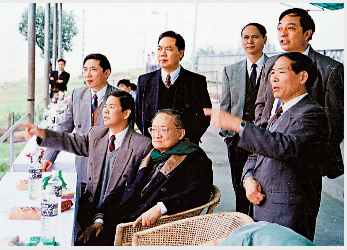
▲1996年金庸回家鄉海寧觀潮。

金庸表示，「我願意盡自己微小的努力，和諸多家鄉人士一起，把海寧的百強縣排名再往前靠」，充分彰顯了「赤子心、家鄉情」。 參與起草香港基本法，推動香港回歸祖國，盡顯金庸的家國情懷。金庸與同為海寧籍的香港實業家查濟民，共同提出了「雙查」方案，為香港的順利回歸打下政權基礎、民意基礎。他還不遺餘力在報刊宣傳香港回歸事宜，為祖國統一傾注大量心血，生動詮釋了「俠之大者、為國為民」的擔當。