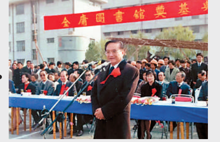
▲1994年金庸出席金庸圖書館落成典禮。

第六次，2008年9月 金庸書院奠基，85歲的金庸來到現場，親手種下桂花樹，還參觀了海寧一中、宏達學校等地，並再次前往鹽官觀潮，題寫下「天下奇觀」的墨跡，他說：「形容錢塘江潮水，沒有比這四個字更貼切了。」