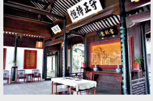
▲金庸書院內的書劍堂。

金庸表示，「我願意盡自己微小的努力，和諸多家鄉人士一起，把海寧的百強縣排名再往前靠」，充分彰顯了「赤子心、家鄉情」。 參與起草香港基本法，推動香港回歸祖國，盡顯金庸的家國情懷。金庸與同為海寧籍的香港實業家查濟民，共同提出了「雙查」方案，為香港的順利回歸打下政權基礎、民意基礎。他還不遺餘力在報刊宣傳香港回歸事宜，為祖國統一傾注大量心血，生動詮釋了「俠之大者、為國為民」的擔當。