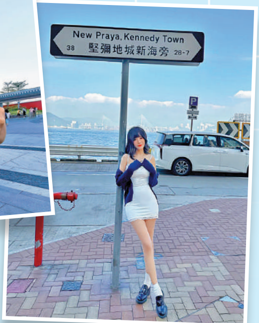
▼聖尼地城海旁是近年旅客打卡熱點之一。