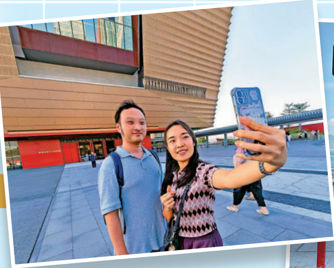
▲故宮文化博物館外形獨特，吸引旅客留影。