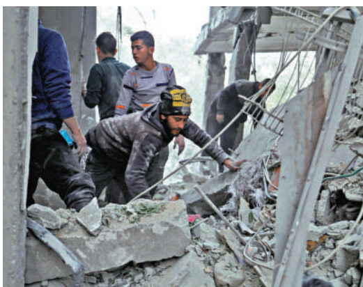
▲民眾在加沙中部努塞拉特難民營附近的廢墟中尋找生還者。

求以色列釋放約500至1000名巴勒斯坦囚犯，以換取關押在加沙的逾100名以色列人質中的40人；但哈馬斯據信暫時放棄要求永久停火，將接受為期40天的臨時停火。