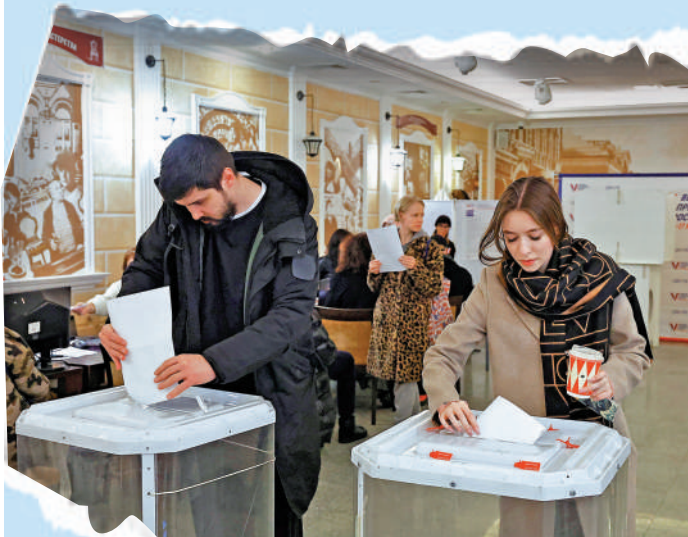
▲俄羅斯選民17日在莫斯科一個投票站投票。