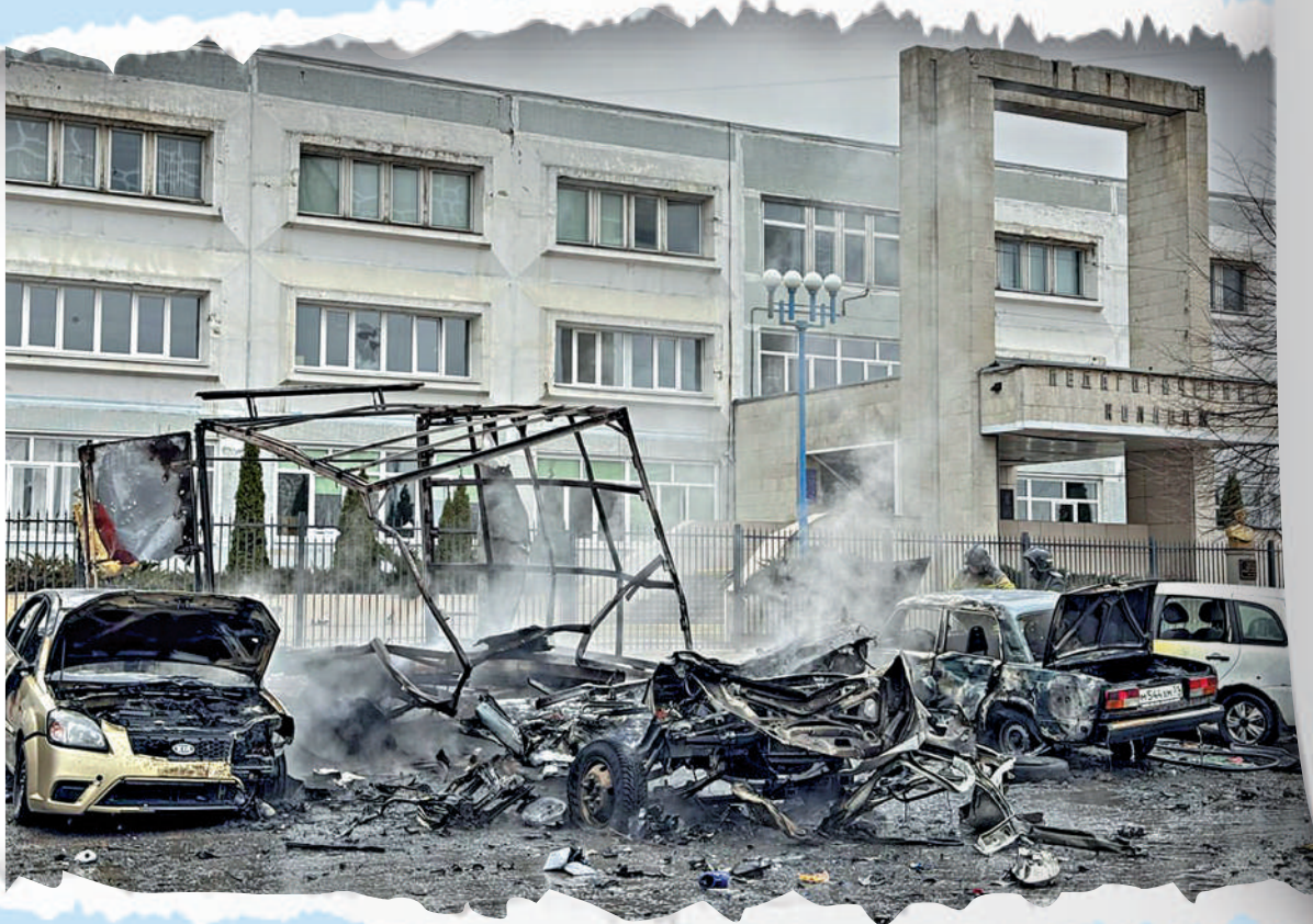
▶俄羅斯別爾哥羅德地區16日遭烏軍炮擊，多輛汽車被炸毀。

俄羅斯第八屆總統選舉正式投票3月15日至17日舉行。俄中央選舉委員會數據顯示，截至莫斯科時間17日下午4時左右，本次大選投票率已經超過70%。然而，自投票開始，出現了約28萬起針對電子投票系統的網絡攻擊，其攻擊源主要來自烏克蘭、西歐和北美。此外，俄烏戰場上，烏軍不斷使用無人機和導彈襲擊俄羅斯境內，甚至對投票站進行炮擊，企圖干擾選舉。