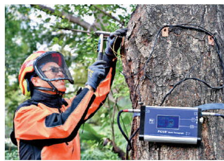
▲聲納探測儀可用作檢查樹木的內部狀況。

康文署指透過應用新科技，除可增加工作效率，也可為風險評估提供更多客觀數據，讓樹木護養部門透過數據分析，適時制訂相應風險緩減措施，在樹木風險與保育之間取得平衡。