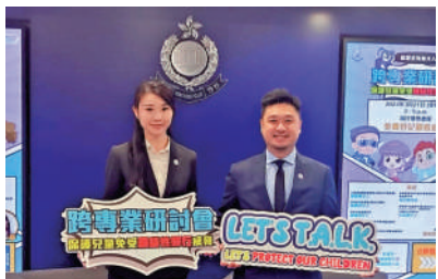
▲警方呼籲家長及老師教導兒童如何應對網絡上潛在的危機。