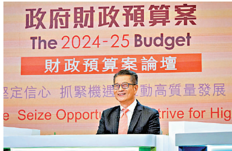
▲財政司司長陳茂波在預算案推出不少新措施拓展經濟。

陳茂波還表示，繼去年10月公布約有30間重點企業落戶或擴展在港的營運後，本周將迎來第二批約20間企業。這50間企業將合共投資超過400億元，創造逾13000個就業機會，推動整個創科生態圈的蓬勃發展。