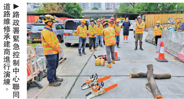
▶路政署緊急控制中心聯同道路維修承建商進行演練。

【大公報訊】路政署緊急控制中心聯同各道路維修保養承建商進行演練，模擬風暴期間巡查全港主要道路，以及處理緊急道路事故，在風雨季前熟習相關工作流程。路政署正計劃在2024年至25年分階段在沙田城門河、大埔林村河及大埔河沿岸的部分行人隧道安裝水浸警告系統，並聯同機電工程署研究