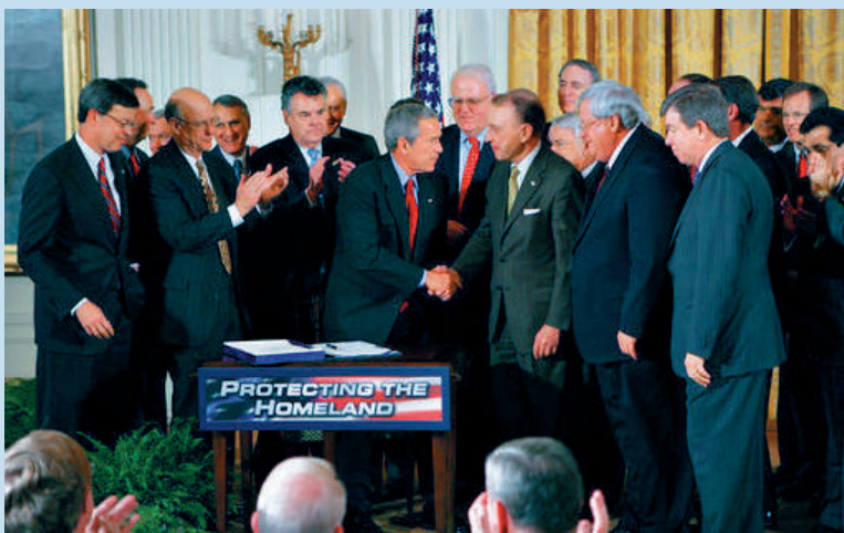
▶2001年10月26日，時任美國總統小布什簽署後，《愛國者法案》完成立法。 網絡圖片

香港特區立法會19日三讀全票通過《維護國家安全條例》。在該條例草案審議期間，美歐多國對香港事務指手畫腳、粗暴干涉。事實上，全球各國都高度重視國安立法，這既是主權國家的固有權利，也是國際通行做法。據統計，美國至少有21部國安法，英國至少有14部，加拿大至少有9部，澳洲至少有4部，立法迅速、判刑重更是他們的突出特點。西方國家不斷根據自身需要，完善本國國安法，卻無端反對《香港國安法》和《維護國家安全條例》，盡顯偽善雙標。