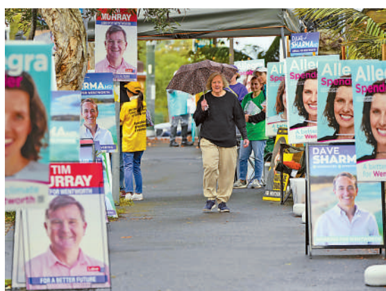
▲澳洲等國出台法律，防止境外干預包括大選在內的多項事務。圖為2022年5月，民眾經過悉尼一個投票站外。

【大公報訊】綜合報道：為防止境外勢力使用不當手段進行干預，損害國家的主權和政治獨立，並構成國家安全風險，多國近年不斷加快立法及實施針對境外干預的法律。