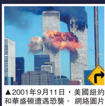
▲2001年9月11日，美國紐約和華盛頓遭遇恐襲。網絡圖片

●二戰之後，美國於1947年制訂了《國家安全法》，並據此設立國家安全委員會。「9·11」恐襲之後，美國只用了45天火速通過《愛國者法案》，並通過其他立法不斷強化偵查執法手段。