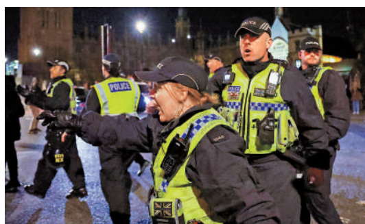
▲英國警察逮捕示威者。

發制人」，驅散可能引發交通堵塞等後果的示威者。該法還禁止示威者挖掘隧道、阻礙基礎設施建設，違者將面臨最高3年監禁。前內政大臣布雷弗曼指出，破壞公共秩序的示威者「極其自私」，有必要通過擴大警方執法權來應對。