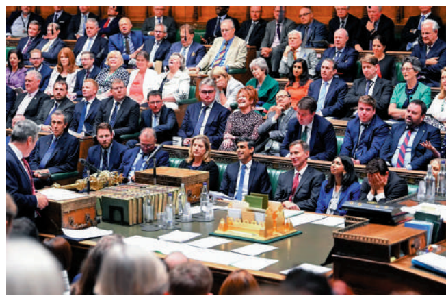
▶英國議會去年7月通過《國家安全法》。 網絡圖片