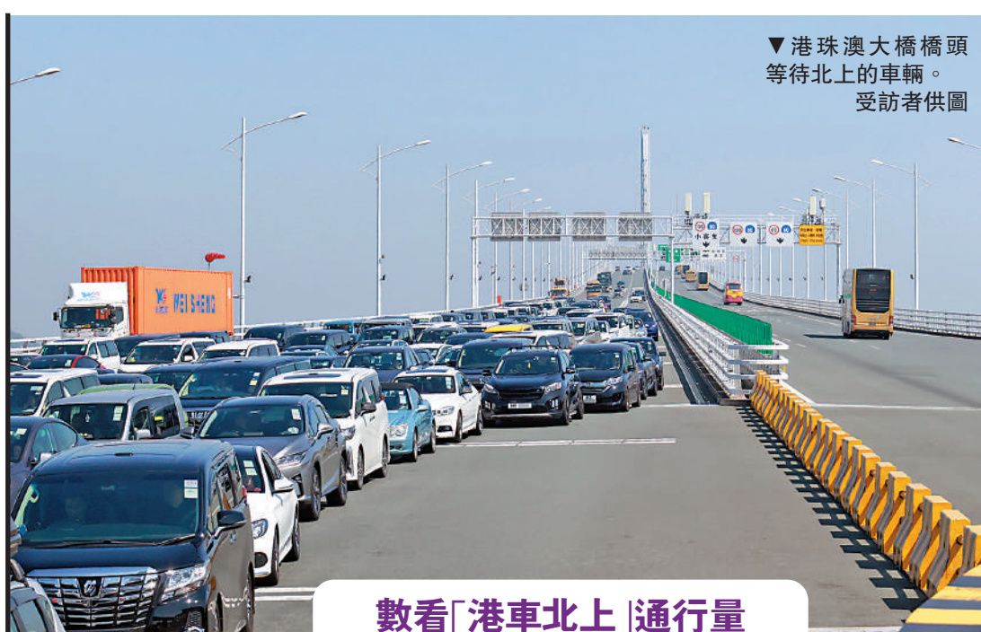
▼港珠澳大橋橋頭等待北上的車輛。受訪者供圖