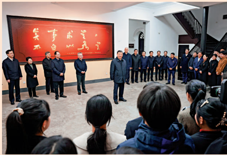
◀18日下午，習近平在湖南第一師範學院城南書院校區考察時，同師生親切交流。