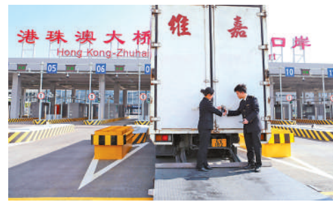
▲港珠澳大橋海關關員對首票跨境一鎖貨物上的關鎖進行驗核。

快線」計劃，要發揮香港在處理冷鏈貨物、鮮活食品、藥品等高價值貨物的優勢，充分利用香港國際機場及港珠澳大橋的基礎設施及運輸網絡，發展多式聯運和高端、高增值物流服務。為推動香港冷鏈產品經港珠澳大橋進口珠海，現時珠海正推動相關指定監管場地建成驗收。據悉，海關總署上月批覆同意在港珠澳大橋珠海公路口岸設立進境水果、冰鮮水產品、食用水生動物指定監管場地，而相關場地計劃今年5月底前建設完成，並盡快通過海關驗收，為冷鏈產品經大橋進口提供硬件保障。