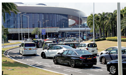
▲每逢節假日，港珠澳大橋珠海口岸會出現港澳車流高峰。

人工智能（AI）亦賦能助力港澳車「北上」。珠海市商務局透露，港珠澳大橋珠海口岸已建設啟用「AI客車防擁堵預警系統」，對將可能發生的擁堵分類預警並即時推送至口岸相關部門掌握車輛通關情況，以便及時做出應急部署。依託現有「港珠澳大橋珠海口岸」微門戶，建設客車通關信息發布平台，提供客車通關信息實時查詢功能，以便港澳車主提前了解口岸通關情況。而在重要節假日對入境車輛逐車發放「通關指引」和「溫馨提示」，提醒司機熟悉通關操作和選擇錯峰通關。