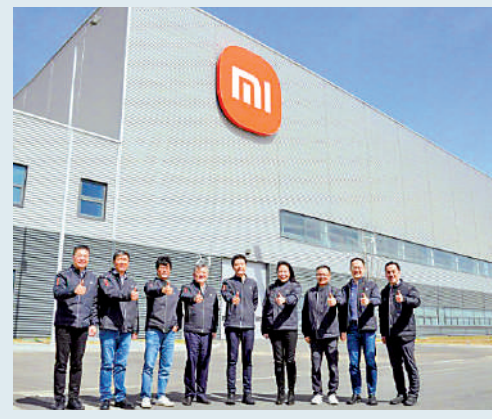
▲雷軍(中)與董事會參觀小米汽車超級工廠。

對於被指測試車輛在京滬高速路段出現路徑通行數據異常，小米發言人回應指，相關結論存在嚴重偏頗，強調測試過程中小米汽車並不存在在高速上違規掉頭、超速行駛、逃漏高速的通行費等違規情況。