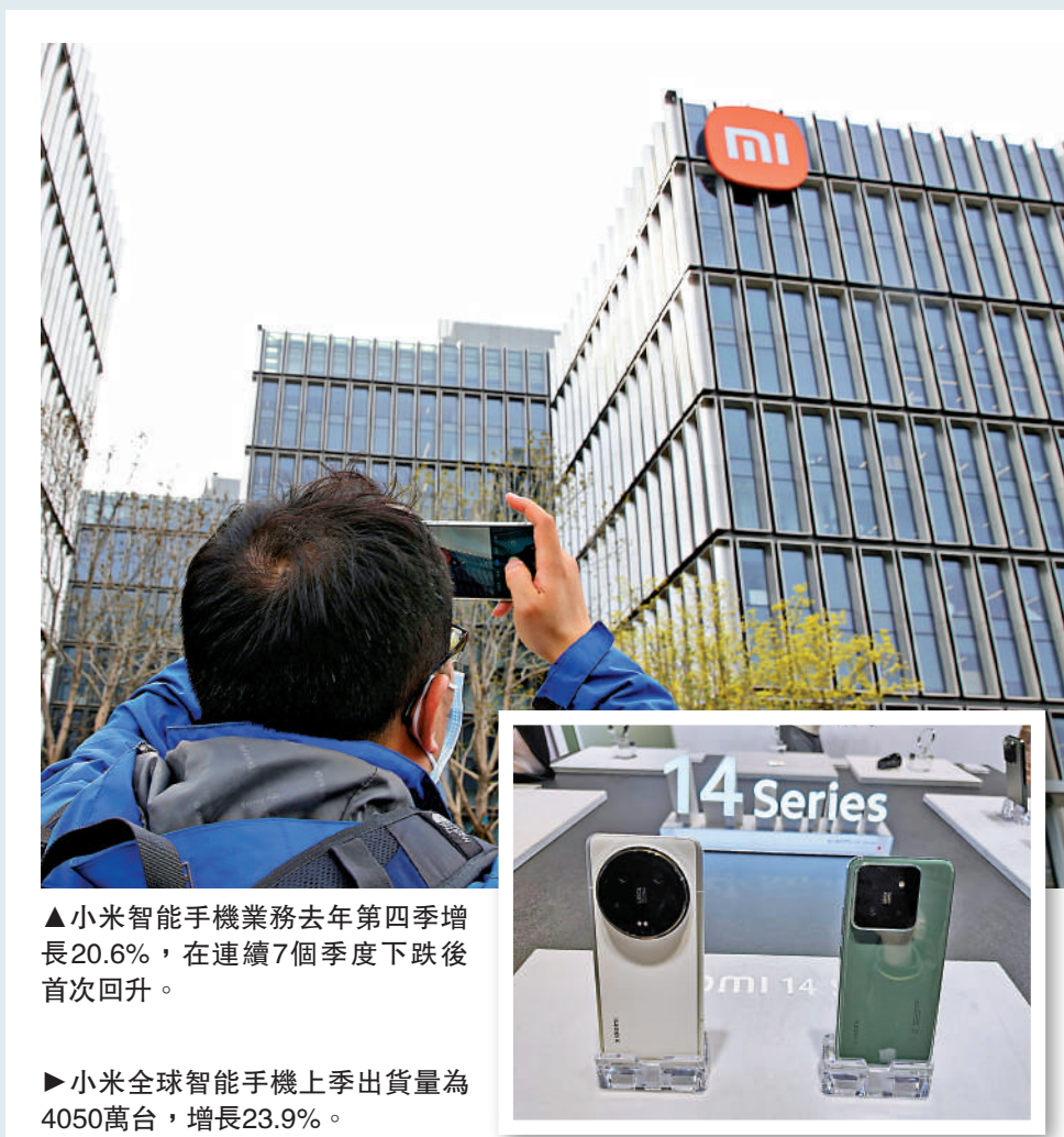
▲小米智能手機業務去年第四季增長20.6%，在連續7個季度下跌後首次回升。

小米昨日股價走勢反覆，開市低見14.74元後反彈，一度升逾1%至高見15.1元，惟午後再度報跌，收市報14.86元，跌0.5%。