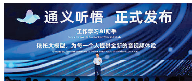
▲阿里「通義聽悟」升級，正式推出音視頻問答助手「小悟」。

自去年6月發布以來，通義聽悟累計已有上百萬用戶，包括學生、老師、記者、律師、金融分析師等群體，活躍用戶日均轉寫音視頻3次以上，平台每天處理字符數約20億字。