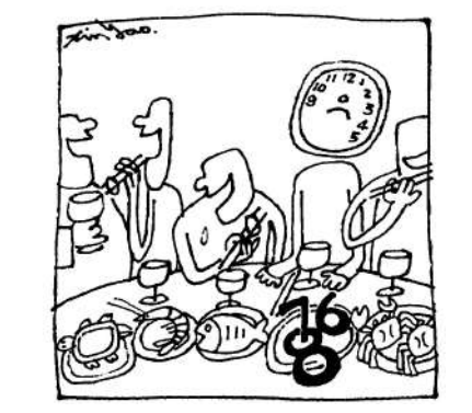
應酬之餐只有一種味道：陪吃——被吃。

故事以導演黃綺琳的真實經歷改編，講述自求學時期就夢想成為職業填詞人的主角用盡方法，希望躋身音樂圈，並期待自己的詞作面世。過程中她既要面對寫作困難，求職又處處碰壁，還不斷面對希望幻滅的殘酷，以致最後要面對現實，暫時擱下夢想。導演以輕鬆幽默的手法表現無奈的際遇，全劇洋溢青春熱血，毫無悶場。由於題材關於廣東歌詞，作詞又