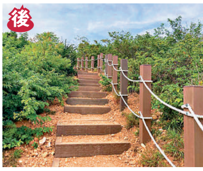
▲當局在環嶼徑以環保塑木建造梯級，比起原始山徑有明顯轉變。