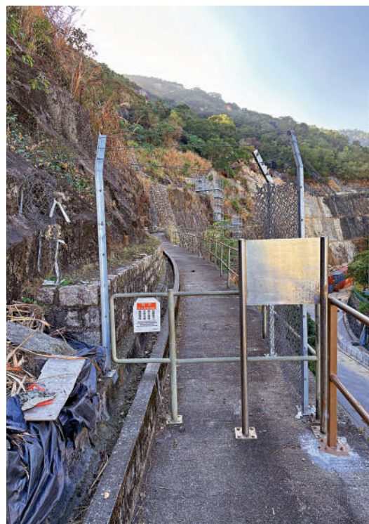
▲斜坡上通往工地的通道，有圍封用的鐵絲網被人剪開。

立法會議員梁熙表示，耀興道附近山坡遭非法開墾屬不能接受，特別是上址早前有山泥傾瀉，山體本已十分脆弱，如今再遭非法開墾破壞，難免令人憂心。他又指有關情況斷斷續續發生，政府部門清理後不久又死灰復燃，他建議部門除了要積極跟進並盡快還原現場外，亦需要採取積極方法，以有效打擊。此外，對於有指有關「私田」為退休人士自行耕種，他建議關愛隊及社署亦需要介入，以了解背後原因，從源頭解決問題，例如設立社區圍園讓他們消磨時間之餘，又不會造成社區隱患。