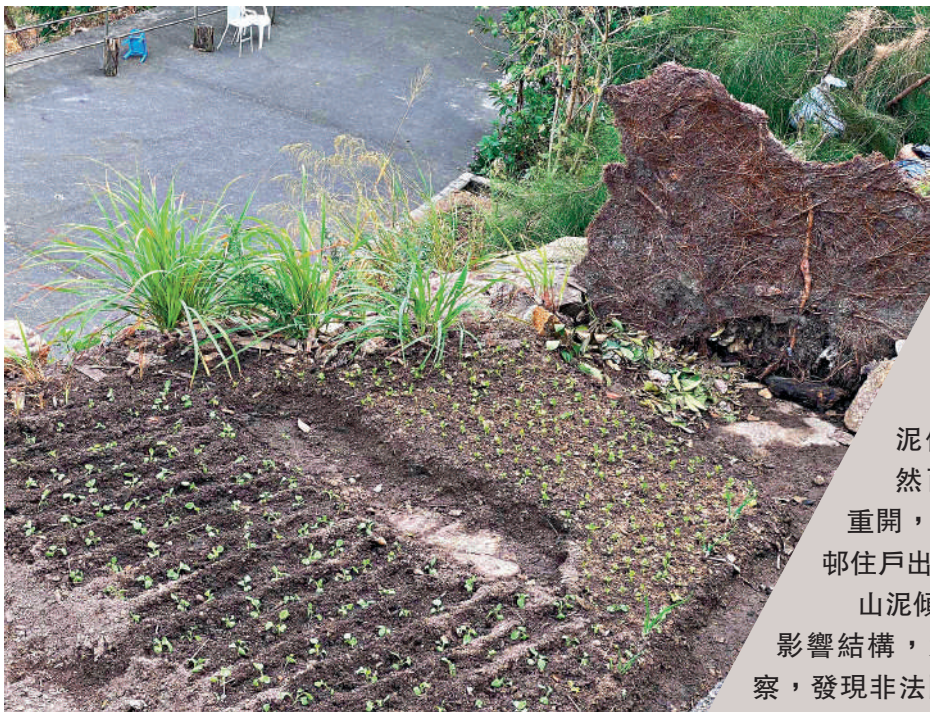
▲在另一處「私家菜田」，可見原本覆蓋斜坡的水泥板被揭起，泥土被翻開種植。