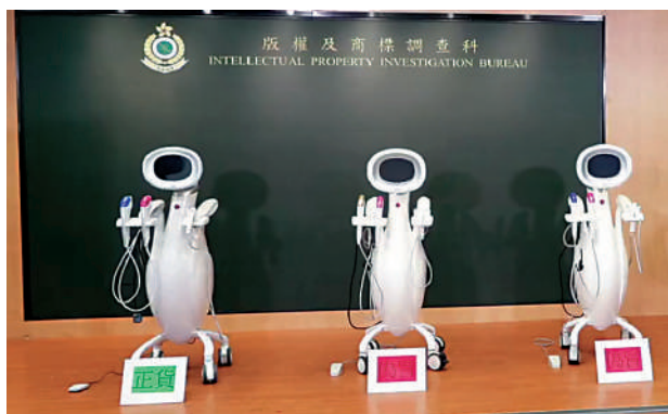
偽冒商標調查科 海關在兩間美容公司檢獲兩部偽冒美容儀器，3人涉嫌觸犯《商品說明條例》被捕。

偽冒儀器售價約一萬元，正貨儀器售價則高出幾十倍，而美容療程單次收費約1000元，正貨提供的服務亦是偽冒儀器的好幾倍。海關提醒市民，由於相關療程涉及高強度能量輸出，如使用不當會有紅腫及灼傷等潛在風險，若使用偽冒儀器，潛在風險會更大，呼籲光顧信譽良好的美容院，並向有關商戶多了解關於美容儀器的資料。