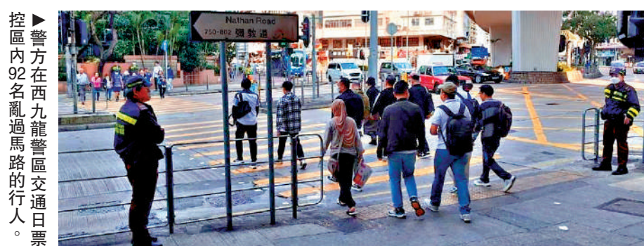
警方在西九龍龍區交通日票控區內92名亂過馬路的行人。