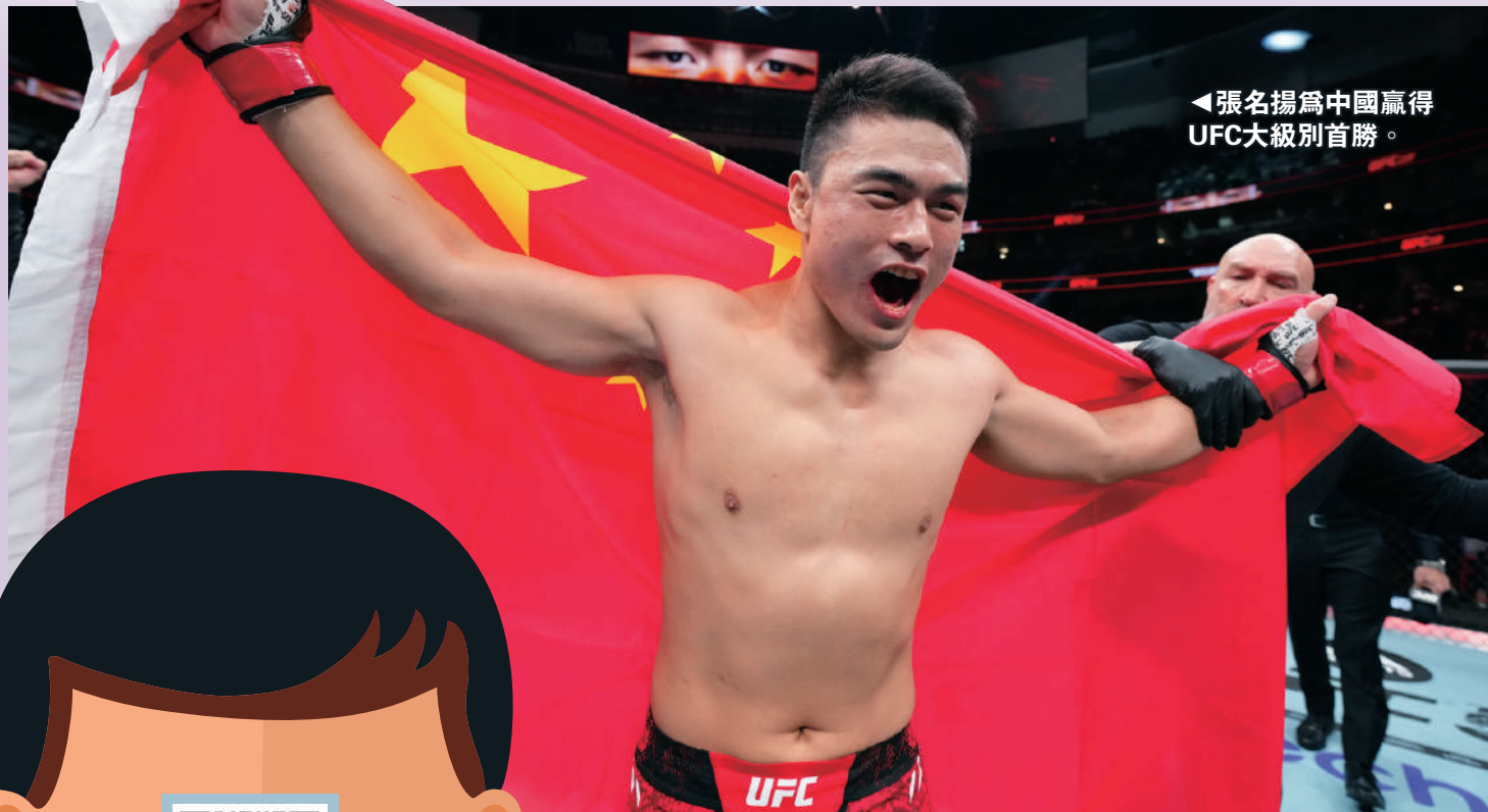
◀張名揚為中國贏得UFC大級別首勝。