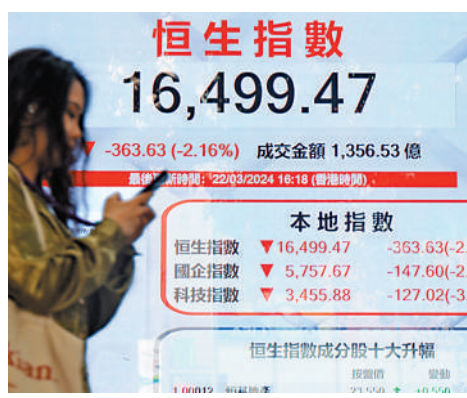
▲恒指昨日下跌363點，收報16499點，大市成交達1356億元。