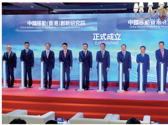
▲中移動在港開設財資中心和創新研究院，昨日舉行成立儀式。

【大公報訊】中國移動通信集團昨日在香港開設財資中心和創新研究院。財政司司長陳茂波出席成立儀式時表示，特區政府致力推動香港發展成為國際創新科技中心，促進更多政、產、學、研合作，推進產業形成；同時，香港作為國際金融中心，非常適合跨國企業集中管理其資金、匯兌、投融資和風險管理等財資活動。他指出，中國移動在香港分別設立研究院和財資中心，積極回應特區政府的政策方向，顯示出對香港經濟、創科發展和金融服務的信心及支持。