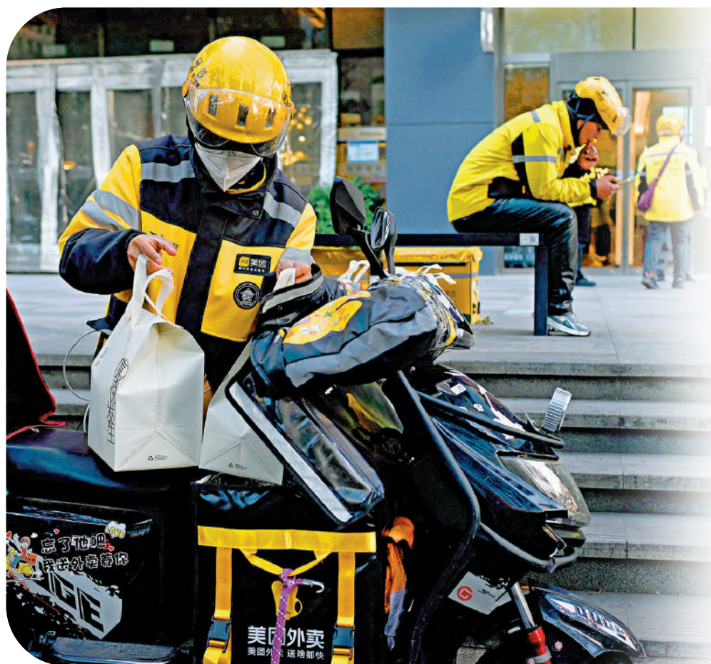
▲美團上季業績優於市場預期，但社區電商業務仍面對虧損。

外電引述阿里巴巴發言人表示，出售哩哩哩ADR的計劃，符合集團的資本管理目標，強調不會影響雙方的業務合作，阿里巴巴旗下相關業務將繼續加強與哩哩哩在各領域的合作。