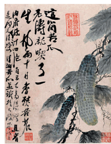
▲石濤的《蔬果冊》（四開冊之一）。