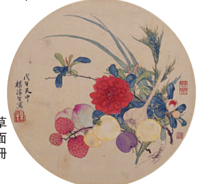
▶居巢的《草蟲花鳥扇面冊》（十開冊之一）。