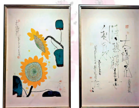
▲陳家冷作品《向日葵》。

陳家冷被譽為新水墨領軍人物。上世紀六十年代，他畢業於浙江美術學院，先後師從潘天壽、陸儼少。改革開放後，陳家冷是最早走出國門的中國畫家之一，並多次在日本、美國、德國、新加坡、荷蘭等地以及中國香港、台灣地區舉行個展和群展。他的作品集個性、民族性和時代感於一身，對新水墨的發展起到了引領和推動作用。