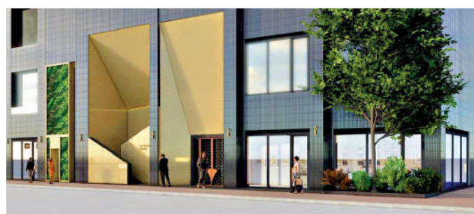
▲一新美術館將在今年遷址港島西營盤西源里一號。一新美術館

展覽現於九龍尖沙咀梳士巴利道十號香港藝術館四樓至樂樓藏中國書畫館舉行，展期至明年2月12日。