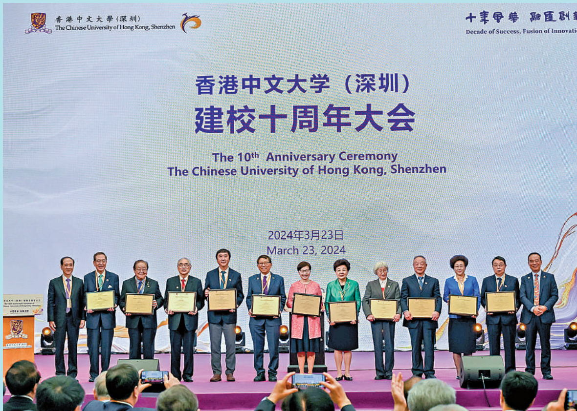
3月23日，港中大（深圳）建校十周年大會舉行。圖為大會現場頒發「大學特別貢獻獎」。

2014年3月21日，教育部正式致函廣東省人民政府，同意批准設立港中大（深圳）。十年間，從一片荒蕪的空地和幾幢廢舊的廠房起步，建成了如今佔地1.3平方公里、建築面積133萬平方米的美麗校園，現有6所學院、1所研究生院和7所書院，師生1.3萬餘名；連續4年位居中外合作大學排行榜第一，就業的畢業生中超六成直接服務於粵港澳大灣區建設，辦學成果贏得社會各界廣泛好評，被譽為香港融入國家發展的「成功樣板」。