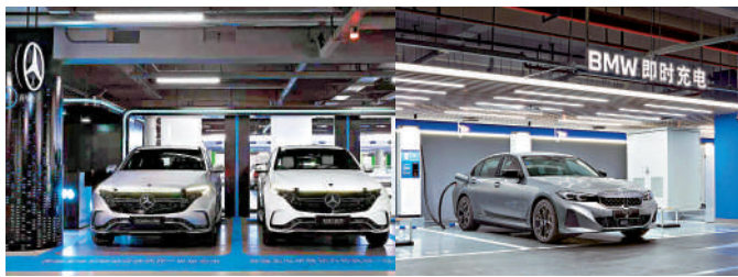
▲梅賽德斯——奔馳（中國）與華晨寶馬合資成立的超級充電網絡。

下一步，北京市朝陽區將不斷推動新能源汽車產業發展，加快研究制定朝陽區新能源汽車產業發展實施意見和支持政策，引導企業在朝陽設立新能源汽車區域總部、結算中心、研發中心，支持汽車後市場發展，推動汽車消費結構轉型升級，為區域經濟高質量發展注入強勁動能。