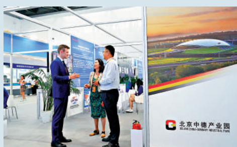
▲北京中德產業園參加去年在北京舉辦的服貿會。