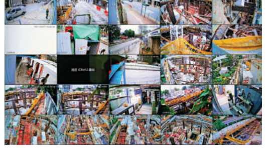
▲華營建築的安全智慧工地系統，包括中央管理平台，用AI相機對地盤進行安全監控（下圖）。