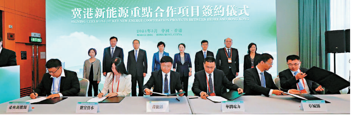
冀港新能源8個合作項目簽約。