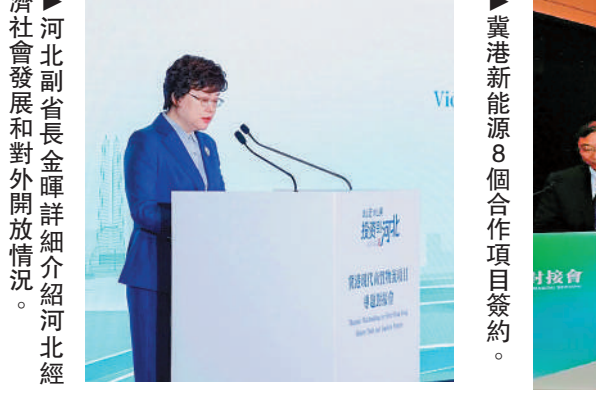
河北副省長金暉詳細介紹河北經濟社會發展和對外開放情況。

金暉副省長此次率團出訪，將持續深化河北與港澳經貿合作，對推動河北發展開放型經濟、實現高質量發展以及落實京津冀協同發展、建設粵港澳大灣區等國家戰略具有重要意義。