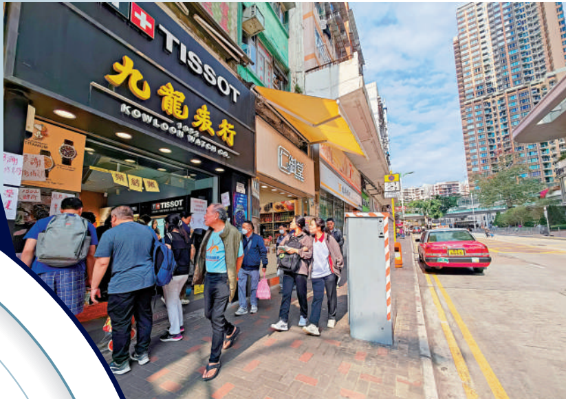
在觀塘屹立超過半世紀的九龍表行，近年生意下滑，難以繼續經營，將於明日結業。