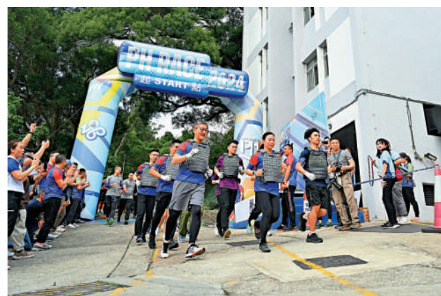
警務處處長蕭澤頤率領長官隊參與處長邀請賽。