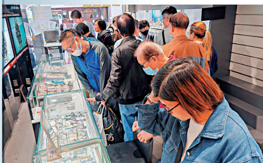
結業消息傳出後，大批街坊及熟客趕至選購心頭好，店內人山人海。