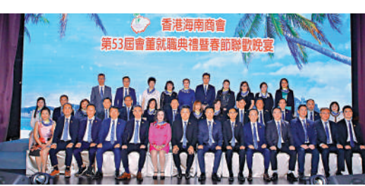
香港海南商會昨晚舉行第53屆會董就職典禮暨春節聯歡晚宴，一眾嘉賓在台上合照。

商務及經濟發展局副局長陳百里致辭表示，「一國兩制」下的香港作為國際金融中心、貿易中心、航運中心，要做好「引進來，