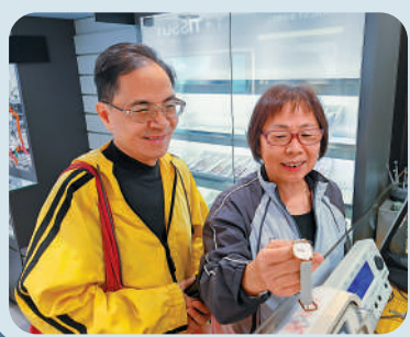
黃先生是觀塘老街坊，懷緬一日跟妻子前來買錶。