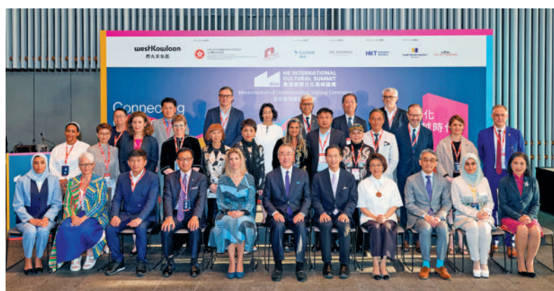
▲參與合作意向書簽署儀式嘉賓合照。

逾百位全球頂尖文化機構領袖昨日（3月24日）出席於香港故宮文化博物館舉行的合作意向書簽署儀式及歡迎晚宴，為即日起一連三日舉辦的香港國際文化高峰論壇揭開序幕。西九文化區管理局當晚與全球21間頂尖藝文機構簽訂合作意向書。