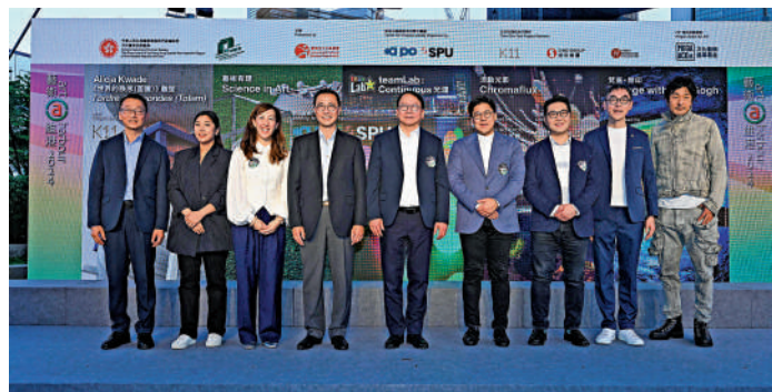
▲「藝術@維港2024」開幕典禮主禮嘉賓合照。

「藝術@維港2024」開幕典禮及傳媒預覽活動昨日（24日）在添馬公園舉行。政務司司長陳國基、文化體育及旅遊局局長楊潤雄、立法會議員霍啟剛、信和集團非執行董事黃敏華、K11集團執行副總裁張之杰、領賢慈善基金常務總監張詩賢、博物館諮詢委員會主席蘇彰德、康文署署長劉明光，以及teamLab創辦人豬子壽之出席開幕典禮。