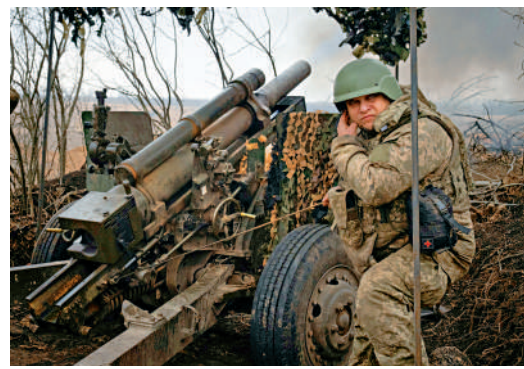
▲烏軍22日在頓涅茨克地區向俄軍開炮。

烏克蘭官員稱，俄軍22日向烏全境能源設施發射了60架滿載炸藥的無人機和90枚導彈，導致100多萬人失去電力供應。俄國防部發言人科納申科夫24日通報說，過去24小時裏，俄軍利用空基遠程精確制導武器和無人機，再次對烏電力和天然氣工業設施、無人艇組裝和測試場所實施集群打擊。烏克蘭全境24日拉響防空警報，烏媒稱基輔發生了爆炸。波蘭武裝部隊同日稱，俄軍向烏克蘭西部發射的一枚巡航導彈侵犯了波蘭領空，並要求俄方作