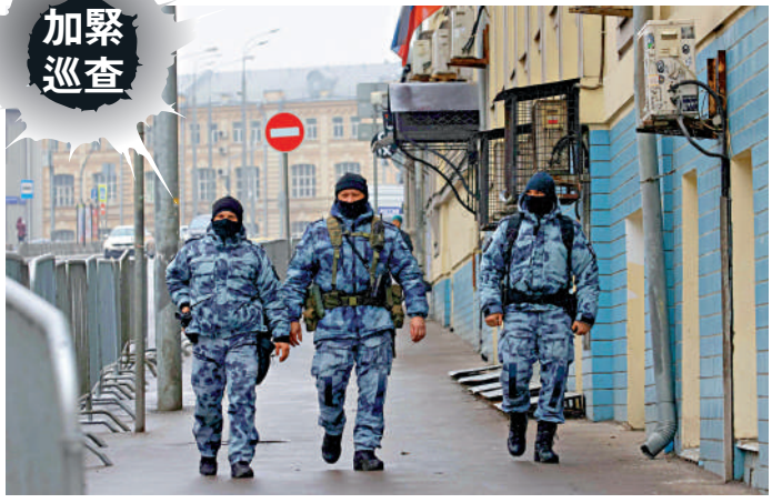
▲俄執法人員24日在莫斯科街頭巡邏。

俄羅斯首都莫斯科近郊「克羅庫斯城」音樂廳（也稱「番紅花市政廳」）22日晚發生恐襲事件，已造成至少137人死亡、152人受傷。有分析認為，持續兩年多的俄烏衝突導致俄境內安保力量不足，加之俄大選剛結束，莫斯科從高度戒備狀態轉為相對放鬆，給了恐怖分子可乘之機。目前，各方圍繞此次恐襲幕後黑手有不同說法。美國等西方國家認定是極端組織「伊斯蘭國」（ISIS）所為，但俄方認為疑犯與烏克蘭有關聯，並指責西方急於下定論是在包庇烏克蘭。