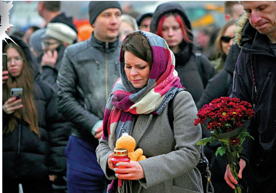
▲俄民眾23日在「克羅庫斯城」音樂廳附近悼念恐襲遇難者。