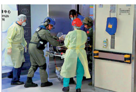
▲中暑暈倒的行山男子，由直升機送往東區醫院搶救，至昨日傍晚證實不治。

至於「三會」成員的委任，麥美娟表示，「三會」成員與區議員一同合作開展不同服務，因此對委任及甄選非常嚴謹，現時程序仍在進行，完成後會適時公布名單。她又說，區議會多年以來，有區議員兼任地區「三會」成員，當局的考慮亦包括是否熟悉地區及反映意見，協助完善地區治理工作，令社區發展得更好。