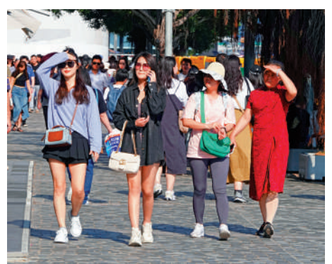
▲昨日天氣炎熱，不少出街的市民都用手遮額，抵擋陽光。