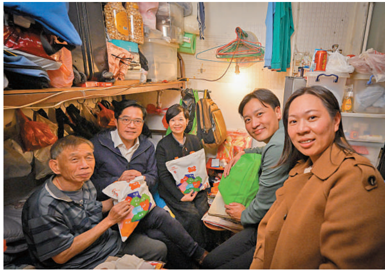
「解決劏房問題」工作組近日會見不同團體，預計8月向行政長官提交報告。圖為財政司副司長黃偉倫（左二）及房屋局局長何永賢（中），月初探訪劏房戶。