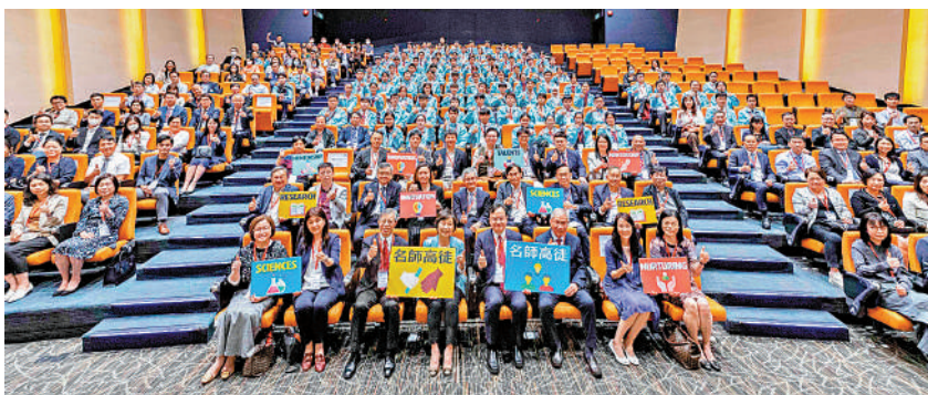
▲第六屆「名師高徒」導師計劃昨日舉行啟動禮，今屆有56名本地知名科學家及工程師擔任義務導師。

名對科學和工程有濃厚興趣的「高徒」。香港科學院院長盧煜明指出，科研發展需有可持續性，科普教育是其中重要一環，有賴集結各界力量推動。「名師高徒」導師計劃匯聚對培育新生代有抱負的科學家和工程師，相信通過該計劃能鼓勵學生追求卓越和創新，為香港未來科技發展培育更多領航員。