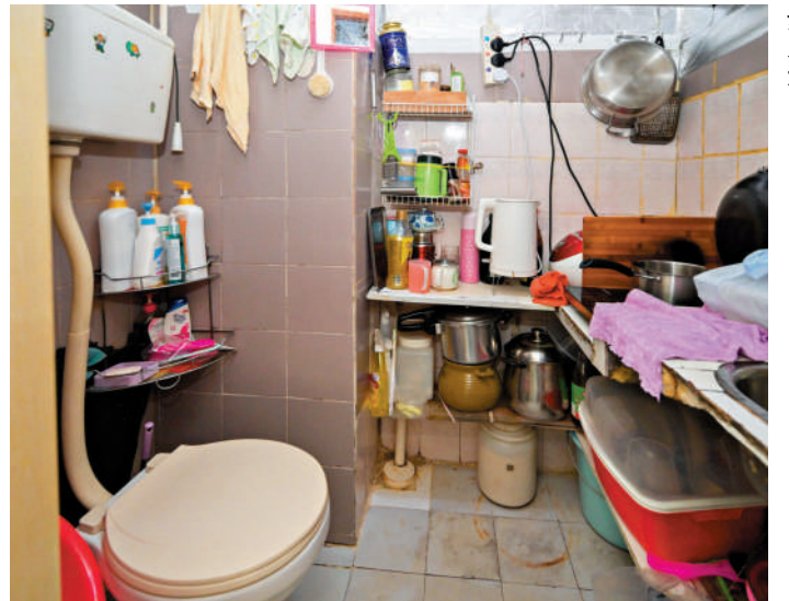
部分劏房衛生環境惡劣，座廁與煮食爐只有一步之遙。

房屋局局長、「解決劏房問題」工作組副組長何永賢上月接受《大公報》專訪時透露，劏房的單位面積、高度、光線、空氣流通、獨立洗手間、獨立水錶、獨立電錶等7項因素，均會納入制定標準考慮。她強調，制定劏房最低標準並非閉門造車，政府已聘請顧問，搜集市面上劏房面積中位數等資料，亦曾「放蛇」視察劏房，掌握更多更真實的資料。