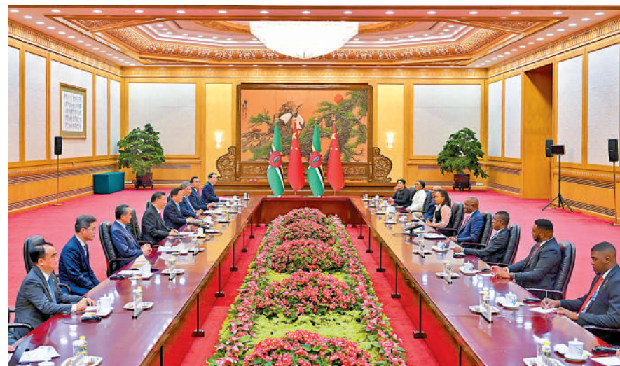
▲3月25日下午，國家主席習近平在北京人民大會堂會見來華進行正式訪問的多米尼克總理斯凱里特。新華社