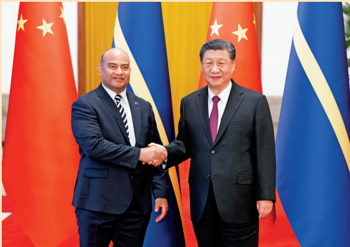
3月25日下午，國家主席習近平在北京人民大會堂同來華進行國事訪問的總理斯凱里特舉行會談。這是會談前，習近平在人民大會堂北廳為阿迪昂舉行歡迎儀式。新華社

3月25日下午，國家主席習近平在人民大會堂同來華進行國事訪問的瑙魯總統阿迪昂舉行會談。習近平指出，今年1月，瑙魯作出堅持一個中國原則、同中國復交的政治決斷，這是符合歷史大勢、順應時代潮流之舉。友好不分先後，只要開啟，就會有光明前途。合作不論大小，只要真誠，就會有豐碩成果。中瑙關係已經翻開新的歷史篇章。中方願同瑙方一道，開創中瑙關係的美好未來，更好造福兩國人民。