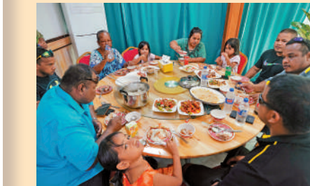
▲人們在瑙魯一家中餐館聚餐。

瑙魯，一個只有1.3萬國民的島國，位於太平洋的袖珍島國，陸地面積21.1平方公里。在這裏，中企承建的光伏發電項目和碼頭升級改造項目，為兩國架起友誼與希望的橋。瑙魯人親近大海，擁有豐富的自然資源，2022年人均國內生產總值達到1.2萬美元。