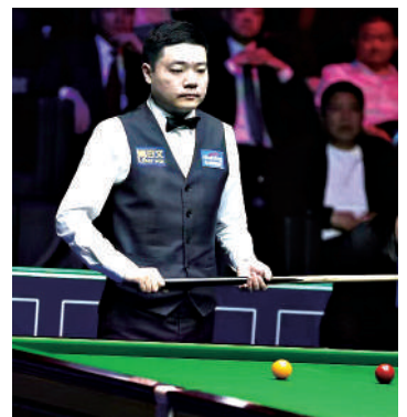
▲丁俊暉奪得世界公開賽亞軍。

丁俊暉認為自己現在打球是能夠打得專注一些，能夠打出心中所希望達到的水平，這是難得的事，希望能夠保持良好的狀態，畢竟比賽是一個接一個的繼續下去。丁俊暉並感謝