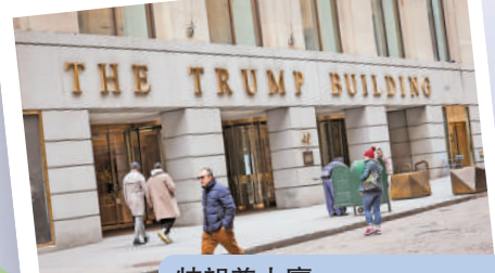
特朗普大廈 位置：紐約市華爾街40號 估價：約2億美元