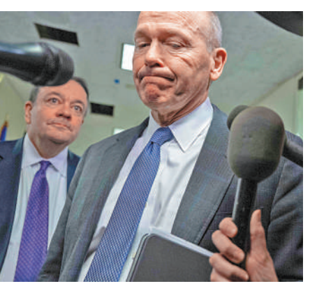
▲波音首席執行官卡爾霍恩（右）將於今年年底卸任。

串事故，招致各方批評。波音25日還宣布，波音董事會主席凱爾納決定不在即將舉行的年度股東大會上競選連任。董事會選舉史蒂夫·莫倫科普夫接替凱爾納，帶領董事會選擇波音下一任首席執行官。波音民用飛機集團總裁兼首席執行官斯坦·迪爾將退休，由斯蒂芬妮·波普接班。