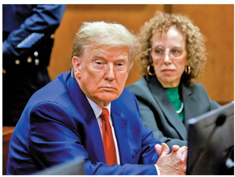
▲特朗普（左）25日在紐約出席「封口費」案聽證會。

特朗普前律師利恩稱，急於籌錢的特朗普可能收下外國資金，例如來自沙特、卡塔爾或俄羅斯的資金。他警告說，在這種情況下，如果特朗普在11月大選中勝出，將構成「國家安全風險」。民主黨眾議員卡斯滕亦表達類似