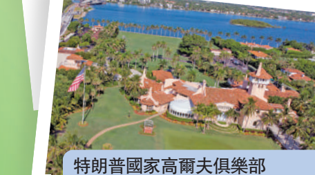
特朗普國家高爾夫俱樂部 位置：紐約州韋斯特切斯特縣 估價：約1500萬美元