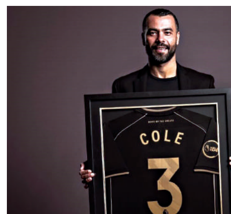
艾殊利高爾晉身英超名人堂後，仙奴與曼聯同有八名前職球員獲此殊榮。阿仙奴名宿艾殊利高爾成二〇二四年第一位晉身英超名人堂的前球員。