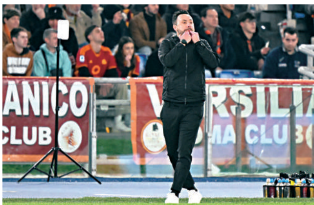
德國拜仁慕尼黑擬找迪沙比接替季後離隊的杜切爾。

現年44歲的迪沙比與白禮頓合約至2026年才屆滿，他執教白禮頓兩年的成果有目共睹，而且除拜仁外，亦有傳利物浦、曼聯、車路士及巴塞隆拿等多家豪門亦有意向他招手，可謂炙手可熱不愁更好路數，若提前解約，白禮頓將要求1200萬鎊賠償。