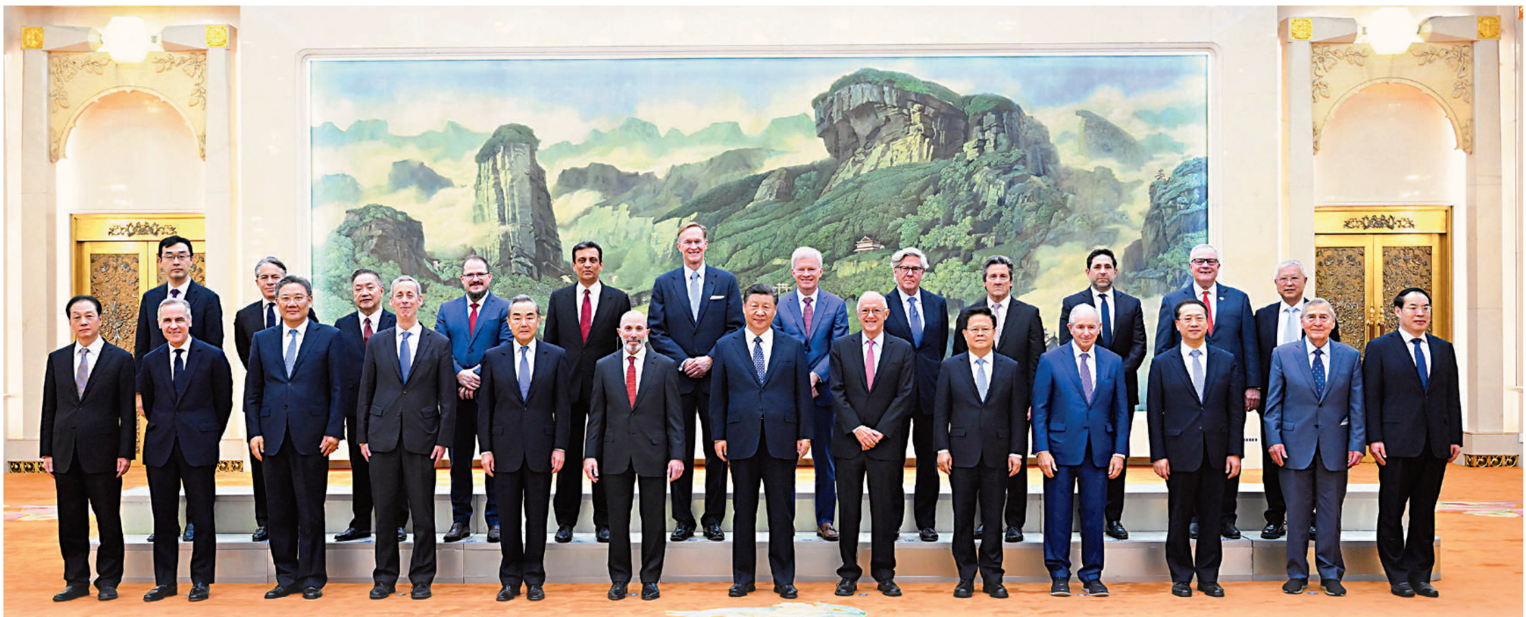
3月27日，國家主席習近平在北京人民大會堂集體會見美國工商界和戰略學術界代表。