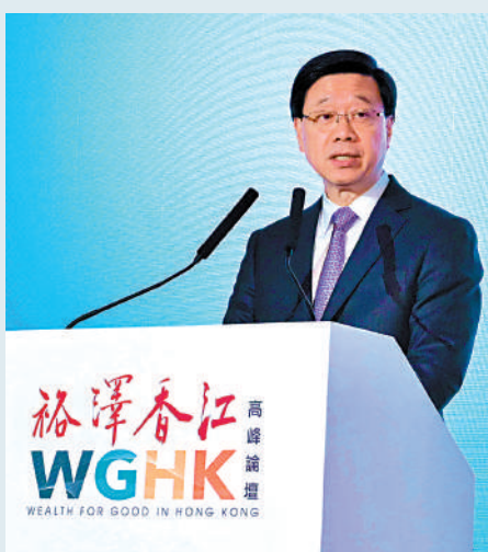
▲行政長官李家超認為，香港能為家辦辦公室的財富創造、保存和傳承帶來裨益。