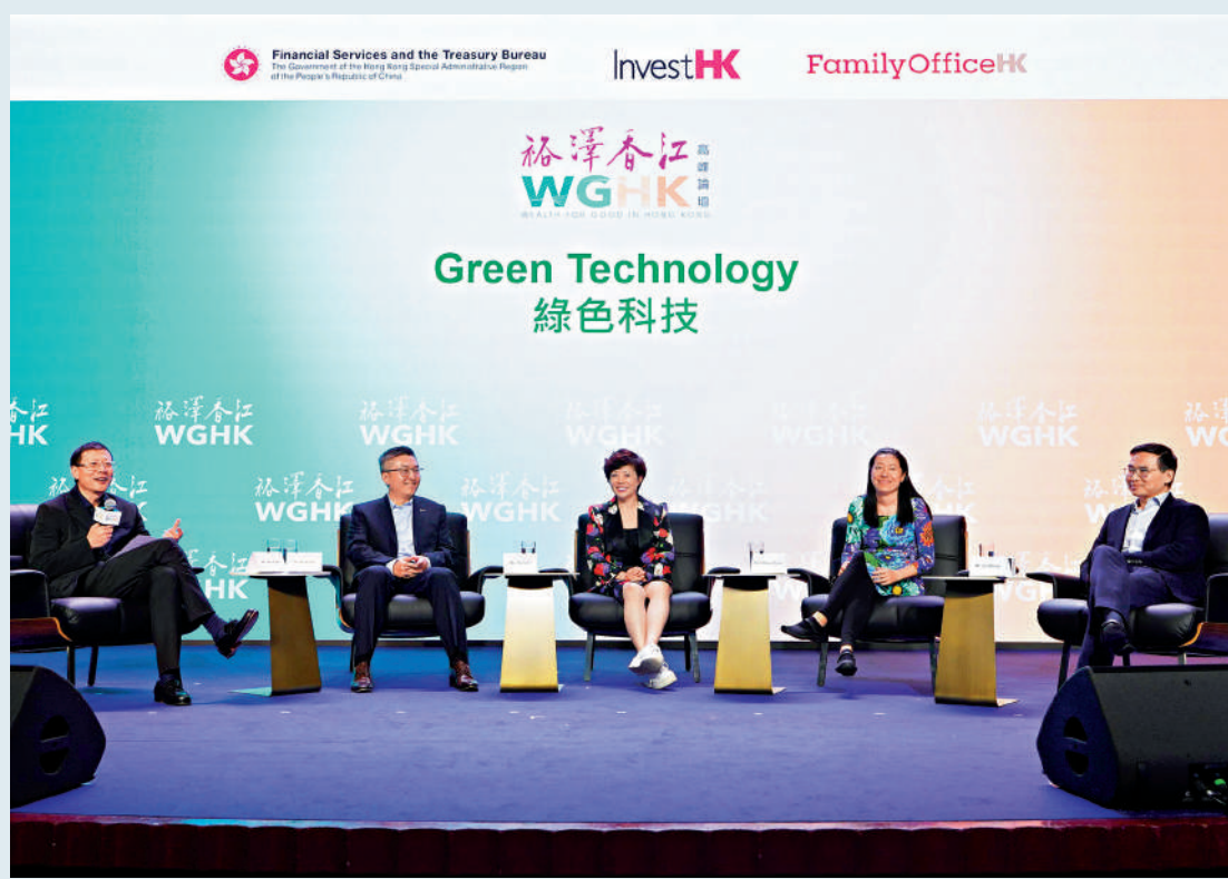
►「裕澤香江」高峰論壇上「綠色科技」主題討論環節上，主持人和演講嘉賓共聚傾談。