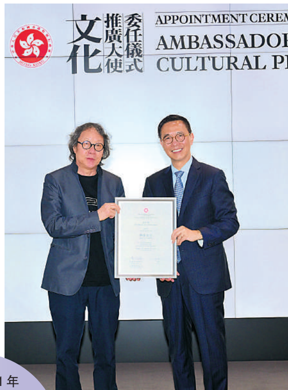
▲藝術家徐冰（左）獲香港特區政府委任「文化推廣大使」。

● 作品曾在大都會藝術博物館、大英博物館和紐約現代藝術博物館等世界著名博物館展出。此外，他曾於多個國際展覽參展，包括威尼斯雙年展和悉尼雙年展