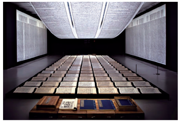
▲徐冰藝術作品《天書》被香港藝術館收藏。