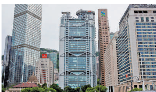
▲面對經營困難的中小企，銀行承諾會以包容態度，提供適切的信貸支援。

銀行公會 銀行業一直支持香港客戶在復甦過程中穩步前行，將繼續與金管局及商界緊密合作，為中小企業提供全面支援