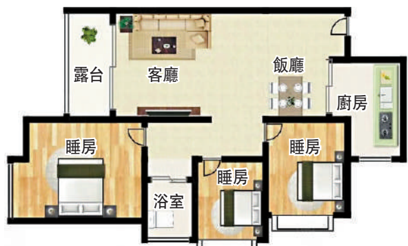
▲東方盛世花園二期78平米三房兩廳戶型圖。