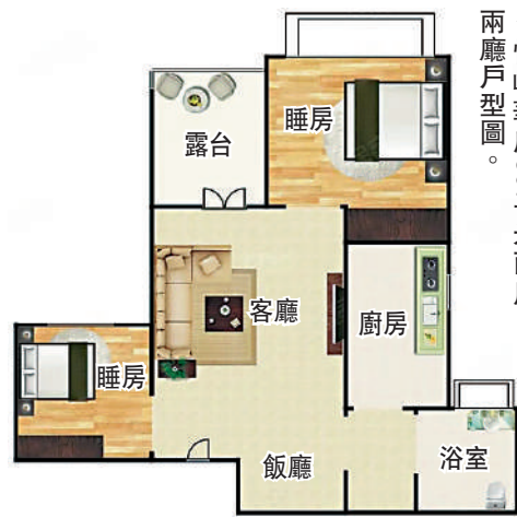
▲悅峰華府80平米兩房兩廳戶型圖。