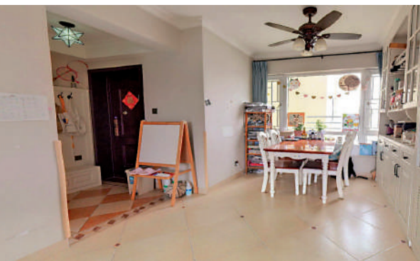
▲百合星城二期政府參考價為每平米4.76萬元人民幣。