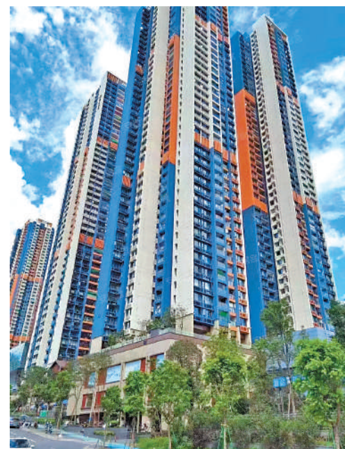
▲悅峰華府樓高51層，提供3536伙，於去年竣工。

系。該街道將依託地鐵3號、5號、14號線和正在建設中的17、25號線，構建與地鐵、快速公交系統等多種公交方式無縫銜接的東站綜合換乘中心。