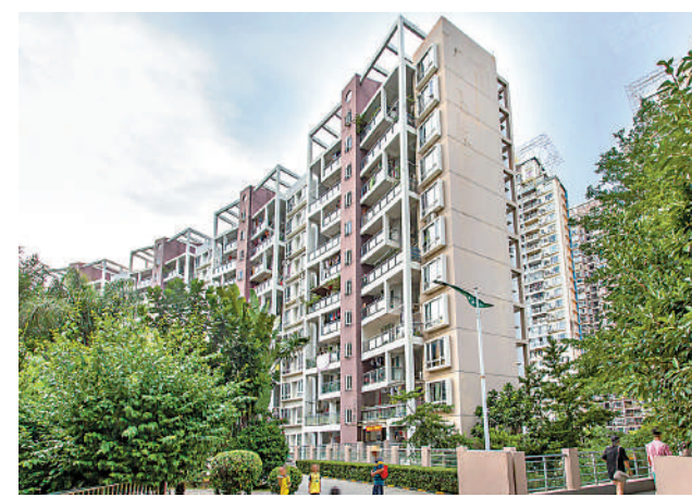
▲百合星城二期為半山山景房，擁有名校資源。