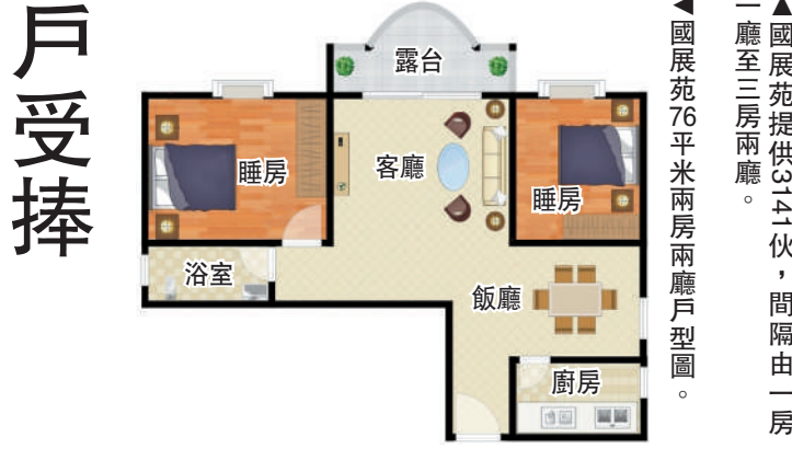
▲國展苑提供3141伙，間隔由一房一廳至三房兩廳。