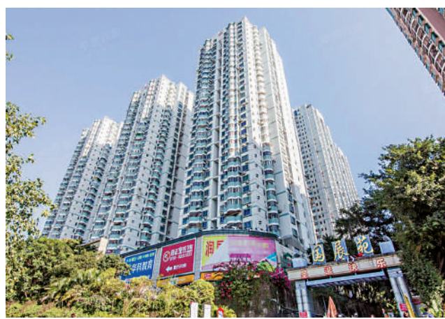
▲國展苑由9幢超高层建築組成，配有多層停車場。