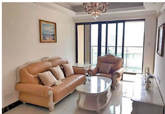
▲東方盛世花園二期面積78平米起，精裝交樓。

周邊商業配套齊全，有時代步行街、華潤萬象匯等，市場特別多，生活便利。交通方面，小區臨近榮超公交站，有十多條線前往市區和龍崗，乘坐公交數分鐘可至布吉地鐵站，有3號、5號、14號三條地鐵線直達全市，也可在深圳東站乘坐火車前往全國各地，十分方便。