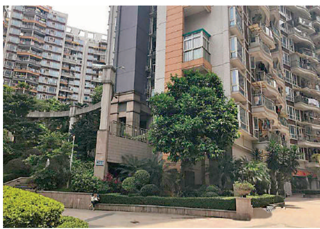
▲東方盛世花園二期臨近布吉關和布吉地鐵站。