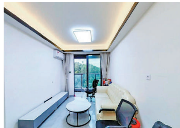
▲悅峰華府單位面積由35至135平米。

布吉街道今年迎來了深圳東站進入「動車時代」的契機，提升深圳東站樞紐地位，立足東進樞紐區位，重點通過強化城際功能、預留度深停靠條件、周邊交通組織等增加路網密度、搭建層級合理的交通體