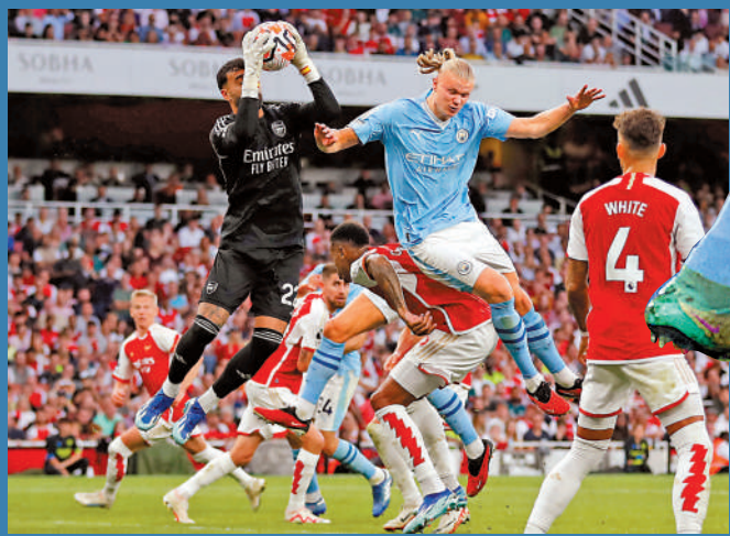
▲曼城（粉藍衣）與阿仙奴（紅衣）今仗都不容有失。