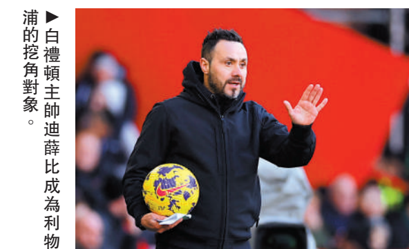
▲白禮頓主帥迪薛比成為利物浦的挖角對象。