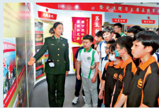
▲香港青少年們認真聆聽講解。

【大公報訊】中國人民解放軍駐香港部隊昨日組織香港青少年愛國主義和國防教育軍事體驗營活動，近150名香港青少年走進駐港部隊新圍軍營，通過參觀見學、互動體驗等方式增進對國防和軍隊的了解，凝聚愛國愛港的意志力量。