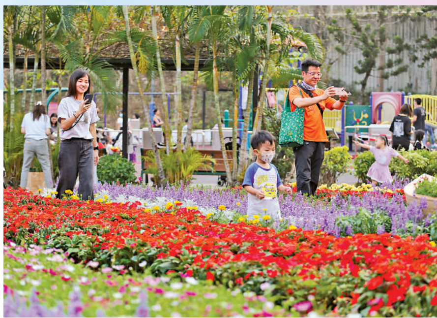
▲深水埗「花深時節」市集昨日舉行，有市民帶小朋友到來賞花打卡。