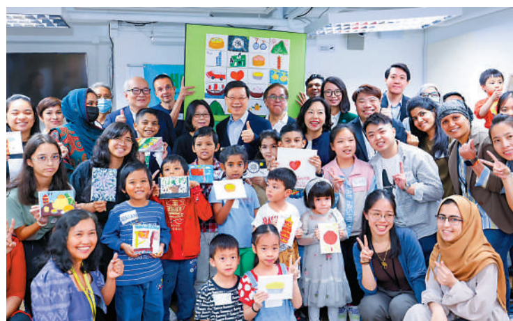
▲李家超伉儷視察灣仔少數族裔人士支援服務中心。

今年增加兩間少數族裔人士支援服務中心，分別設於九龍中及新界東，令支援服務中心總數增加至10間，並邀請這10間中