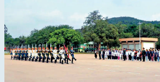
▲近150名香港青少年走進駐港部隊新圍軍營，增進對國防和軍隊的了解。

組織香港青少年愛國主義和國防教育軍事體驗營，是駐港部隊適應香港從亂到治走向由治及興新階段，面向香港青少年開展愛國主義和國防教育的創新舉措，對於充分展示駐軍威武文明良好形象，充分激發香港青少年愛國愛港熱情，打牢服務香港、報效國家的思想根基，具有重要意義。