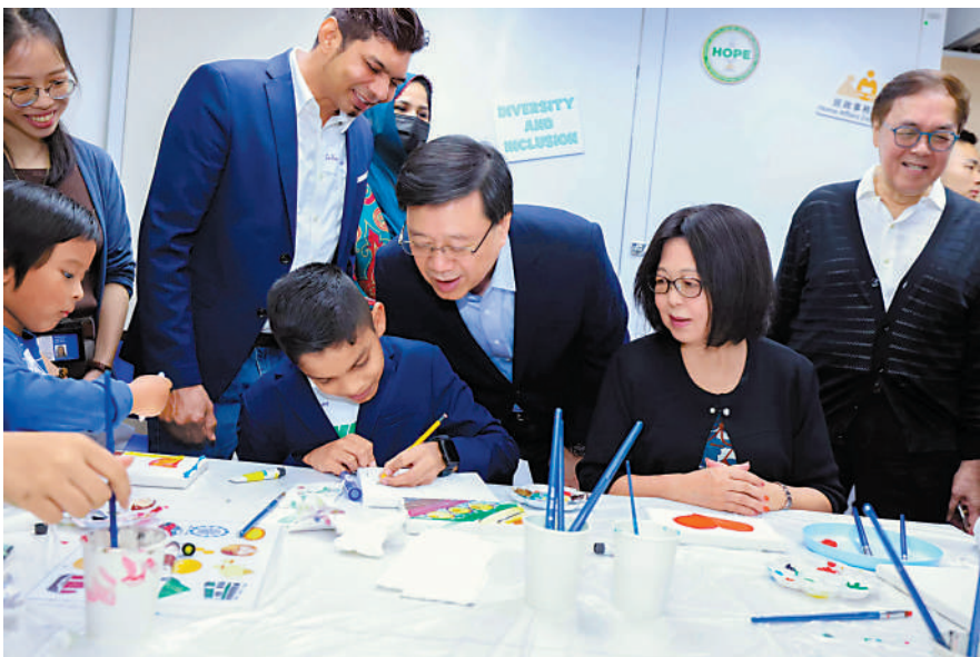
▲李家超與太太與興趣班參加者一起畫畫聊天。