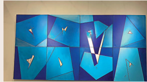
▲霍剛的作品將東方寫意融入西方幾何構圖之中。大公報記者顏現攝