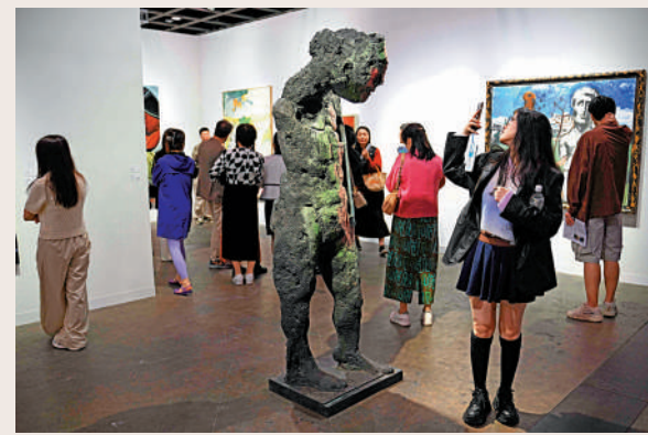
▲觀眾在巴塞爾藝術展香港展會「打卡」藝術品。