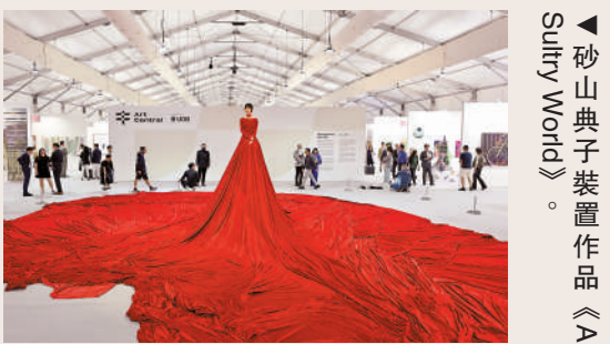
▲砂山典子裝置作品《A Sultry World》。