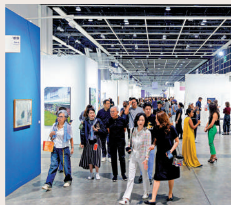
▲今年巴塞爾藝術展香港展會全面恢復至疫情前的規模。