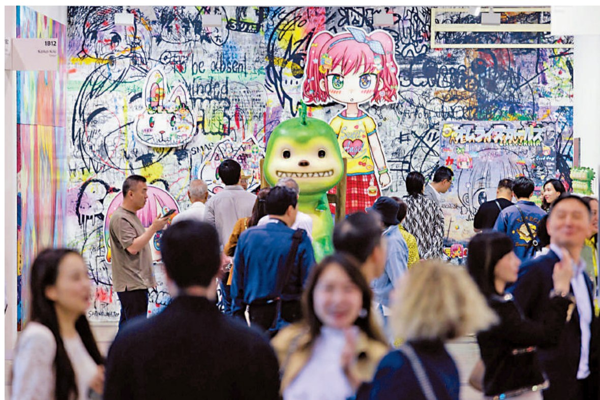
▲巴塞爾藝術展香港展會人氣旺。