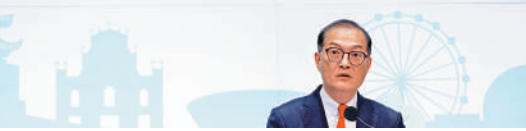
▲醫務衛生局局長盧寵茂表示，長者醫療券大灣區試點計劃，當中包括廣州、中山及深圳，預計今年第三季度可以陸續開展服務。