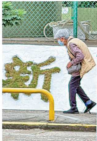
▲醫療券福利跨境攜帶，讓有需要急診醫療支援的跨境老年人群及時獲得政府的醫療支援。