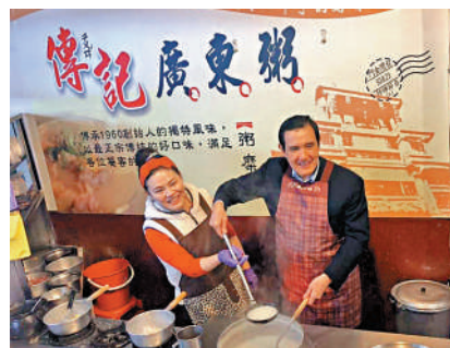
▲馬英九此前在台灣品嚐廣東粥。