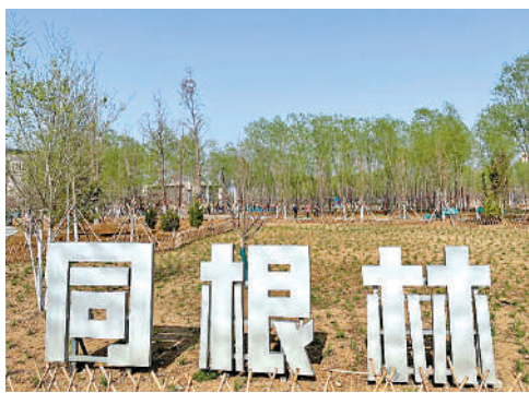
▲台兒莊同根林。

2009年，首家海峽兩岸交流基地在台兒莊設立。據介紹，這些年來，台灣一直是台兒莊境外遊客第一大來源地。鄭先生說，他很喜歡來大陸，這些年到過大陸很多地方。「像台兒莊一樣，大陸各地建設得太好了，看了讓人欣喜。」他表示，回台後會跟家中孩子們講這次來台兒莊的見聞，「他們不一定聽得懂，因為現在台灣的課本已經把台兒莊大捷這段歷史刪掉了。」他說，但講一講還是有助孩子了解歷史，有機會的話，要帶他們來台兒莊看看。