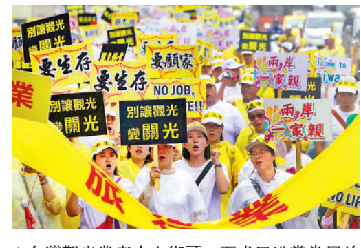
▲台灣觀光業者走上街頭，要求民進黨當局放開陸客觀光。

有旅遊業者批評，過去陸客來台旅遊時都是團進團出，一待就是7天，會到全台各地遊覽。現在東南亞、日韓旅客大多待在中部地區或自由行，對旅遊業者幫助不大。台當局用再多數字來美化觀光，業者仍然無感。只有立刻解除赴大陸禁團令，恢復兩岸旅遊才是上策。台灣商業總會主席賴正鎰也認為，來台旅客回流太慢，若台當局無法開放陸客來台，今年設定的目標鐵定無法實現。