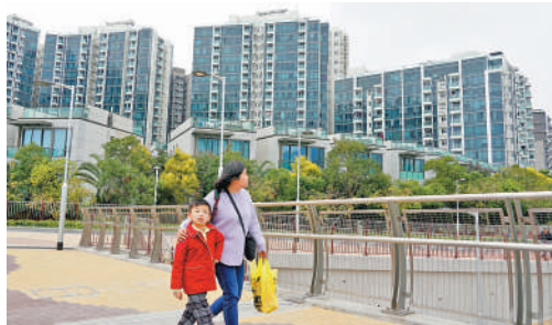
繼續做好教育與住屋方面的配合，香港才能保持搶人才的優勢。