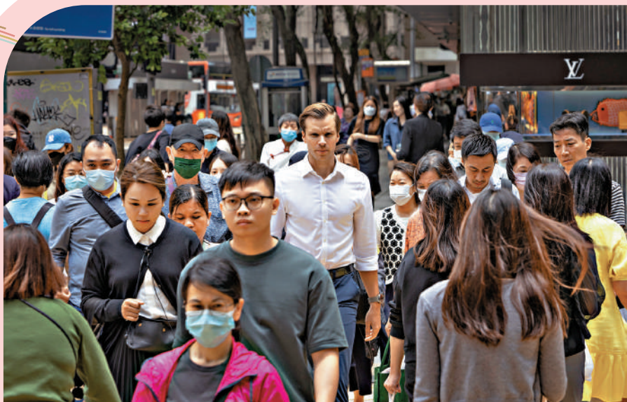
香港完成《維護國家安全條例》立法，對整體經濟發展帶來重要支持。