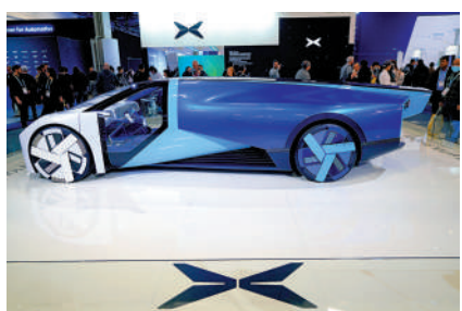
▲2024年美國拉斯維加斯消費電子展上，小鵬展示電動飛行汽車AeroHT。

建銀國際在第二季度港股展望報告指出，恒指短線在17000點附近會遇到較強阻力，第二季度將呈區間震盪的W型走勢，前低後高格局；恒指區間介乎16000點至18000點；科指區間介乎3300點至3900點。投資者可採取區間交易及啞鈴型配置策略，持有高股息藍籌，另精選互聯網、科技、消費及製造業出海的龍頭股。