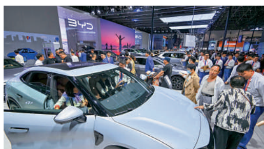
▲比亞迪上周銷量30.2萬輛，按百分比計算，為月度銷售之冠。

近期中地車企大規模減價，加上購車補貼政策到期，推動上月多數車企銷售或交付量錄得增長。新能源車龍頭企業比亞迪 (01211) 銷量同比升46%至30.2萬輛，按百分比計算，為月度銷售之冠；理想汽車 (02015) 則以39.2%的增速，居第二位，交付量為2.8萬輛，至於吉利 (00175) 升38.5%至15.08萬輛，緊追其後。另外，據內媒報道，比亞迪近期確定了王朝網、海洋網今年的內部銷售目標，王朝網為170萬輛，海洋網為160萬輛，並不包海外市場。