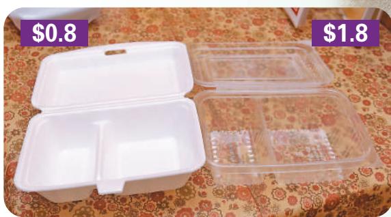
▲現時使用的發泡膠飯盒（左）是8毫一個，而新飯盒（右）就要1.8元一個，足足多了逾倍成本。