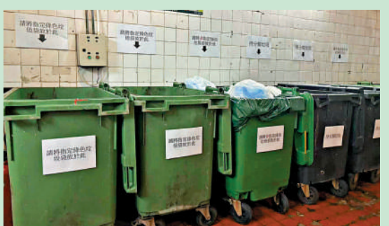
▲在試點新達廣場垃圾房內，指定袋垃圾桶未裝滿，但用指定袋「包底」的非指定袋垃圾桶則將近爆滿。

商場內一間餐廳獲派發100公升指定袋，店員劉小姐說，該店已按商場指示，將廚餘和一般垃圾分類，每日共有6袋垃圾，「商場管理人員說只需將廚