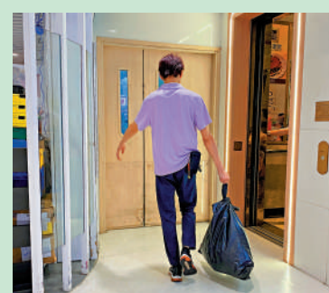
▲在另一試點屯門卓爾廣場，有商戶仍使用黑色大垃圾袋裝垃圾。

商場內有蔬果店獲發30個35公升指定袋，負責人林小姐說，首兩日共使用了4、5個指定袋，主要是廚餘垃圾，紙張、膠樽則分類交給管理處回收。她說已聯繫回收廚餘的農舍，相信有助日後減少使用指定袋。