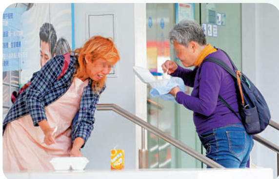
▲有領取飯盒的市民即場在附近進食，一旦實施「走塑」而又沒帶餐具，對他們來說會增加不少困難。