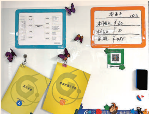
▲辦公室內的零廢棄「基金」展示牆。

與居民區不同，辦公樓因商業特色明顯，衍生出的廢棄問題和管理方式也會不同。基於辦公樓的三種業態，徐嘉憶表示，辦公業態裏，最主要的廢棄物是紙，要盡量做到無紙化辦公，妥善處理紙箱等廢棄物；辦公人員要少點外賣，如此就能從源頭上減少80%左右的垃圾。在商業業態中，餐飲類企業廚餘垃圾變多，因此要做好第一輪垃圾處理後再丟棄。對於公共空間而言，煙頭、塑料製品等垃圾變多，需要多放置分類垃圾箱，張貼垃圾分類指示標識等。