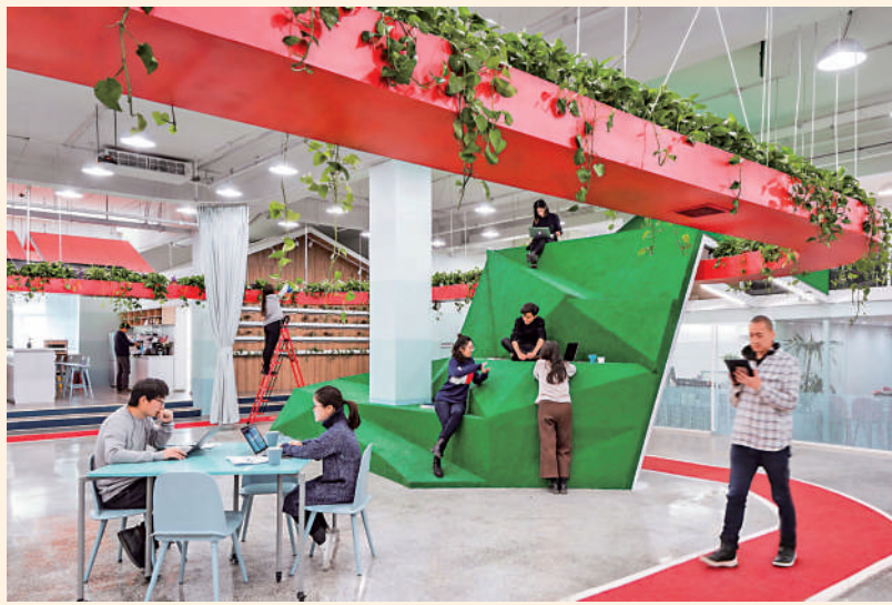
▲北京一公益基金會總部打造綠色辦公空間，室內綠植環繞。