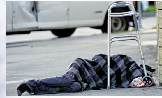
▲有露宿者倒在洛杉磯街頭。

由於許多無家可歸者與家人關係疏遠，幾乎沒人會注意到他們的死去。對於無人認領的死者，美國各地的城市只能將其遺體安葬在公共墓地。洛杉磯縣去年12月埋葬了1937具無人認領的屍體，包括非法移民、兒童和無家可歸者。