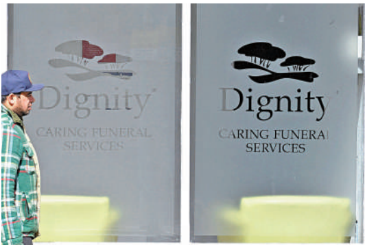
▲行人經過倫敦一家殯葬公司門前。