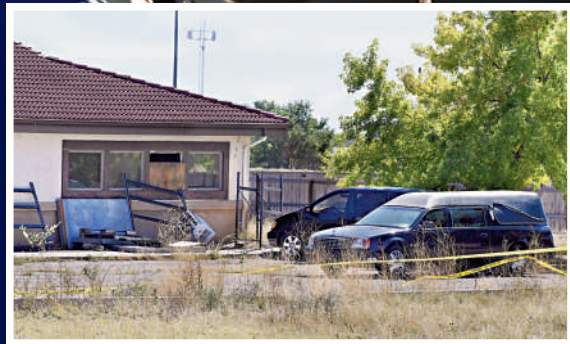
▲去年10月，警方封鎖「回歸自然殯儀館」進行調查。

全美各地沒有法律強制驗屍官或法醫等工作人員將無名屍的資料上傳到數據庫。南佛羅里達大學法醫人類學家金默勒表示，現有的NamUS其實可以解決大部分屍體無人認領的個案，但問題的關鍵在於有關人員「是否有這樣做的意願」。