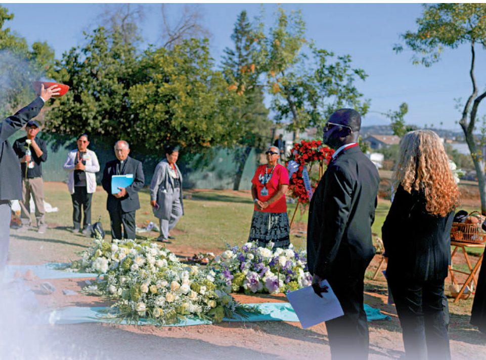
▲去年12月，一名無人認領死者的遺體在洛杉磯下葬。