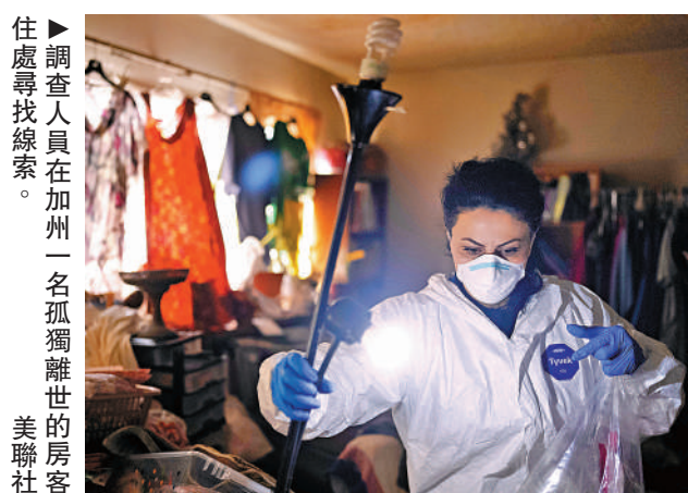
住處尋找線索。美聯社