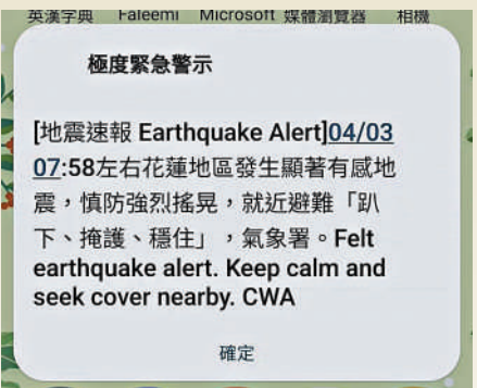
▲有台灣民衆批評當局在餘震發生後才透過手機短訊發出地震警告。