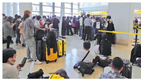
▲日本那霸機場航班昨日受到海嘯警告影響，大量旅客滯留。

分析顯示，本港的地震烈度為修訂麥加利地震烈度表的第三度，即室內有感，類似小型貨車駛過的震動。