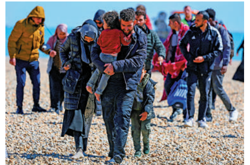
▲2023年8月，難民在英國海灘行進。

去年12月，提升工作簽證薪金門檻的措施已由英國內政大臣克萊弗利在下議院預告。他表示，此舉的目標是在未來幾年內，將英國每年的淨移民人數減少30萬，但尚未制定具體的時間表。