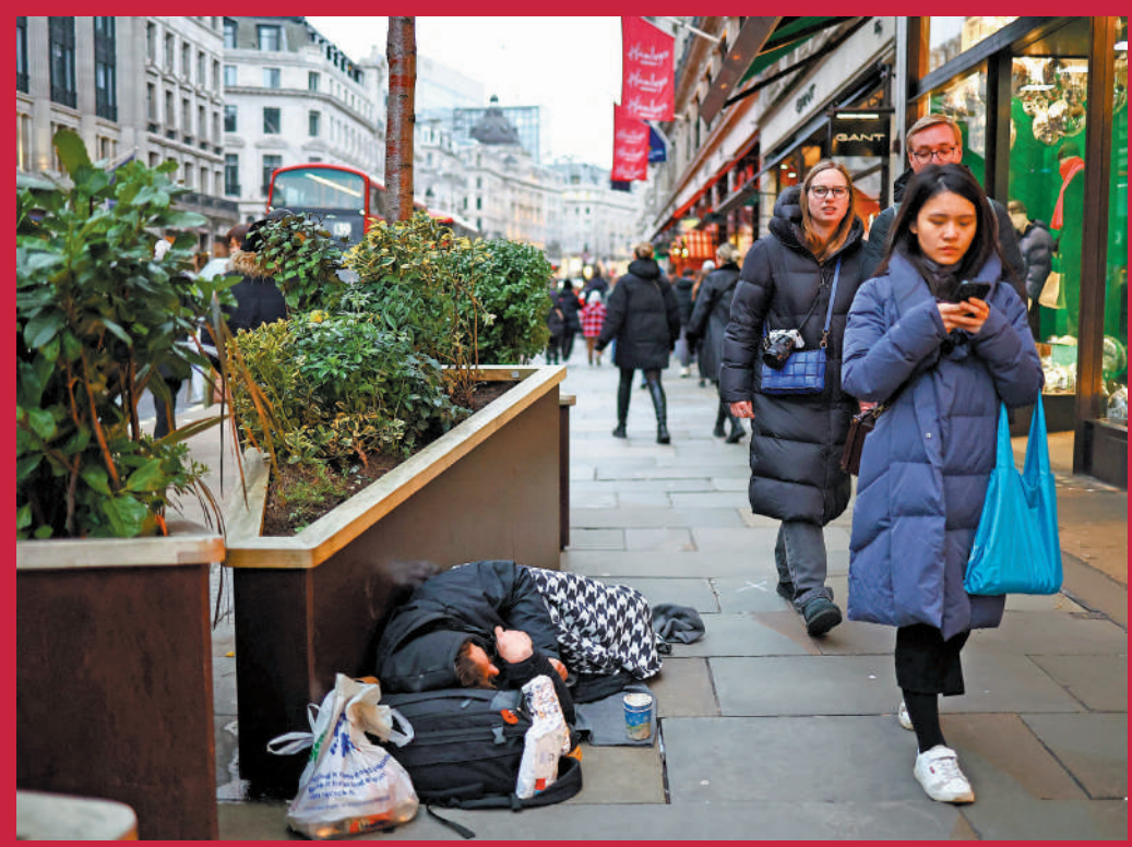
▲英國正式提高海外技術工作簽證薪金門檻。圖為一名躺在倫敦市中心的露宿者。

英國政府持續收緊移民政策，於4日正式提高海外技術工作簽證薪金門檻。自此除了少數例外，英國僱主若聘用海外員工到英工作，其年薪要求從先前的2.62萬英鎊（約25.8萬港元）上升至3.87萬英鎊（約38.1萬港元），大幅上漲48%。英國首相蘇納克此前撰文指責部分移民「濫用制度」，直言英國不歡迎「沒貢獻」的移民。