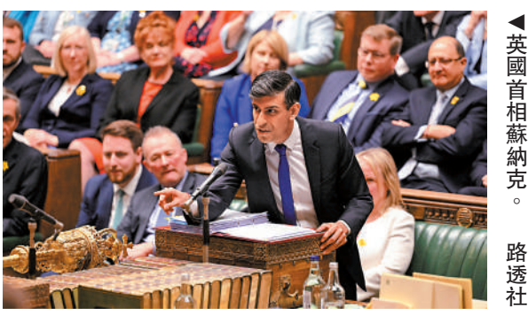
▲英國首相蘇納克。

歐洲人權法院是根據《歐洲人權公約》設立的常設機構。英國是《歐洲人權公約》的初始簽署國之一，曾於1951年率先批准公約。（綜合報道）