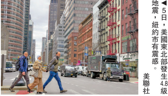
▲5日，美國東北部發生4.8級地震，紐約市有震感。

紐約州州長霍楚爾在社交媒體X上發文稱全紐約州都有震感，並表示團隊正在評估可能發生的影響和任何損害，將全天向公眾通報最新情況。白宮表示，總統拜登已聽取了有關地震的簡報，並「在了解更多信息時與聯邦、州和地方官員保持聯繫」。