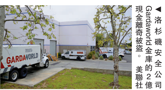
▲洛杉磯安全公司Gardaworld金庫的2億現金離奇被盜。

消息人士稱，這起入室盜竊案已成為洛杉磯史上現金金額最大的盜竊案之一，涉案金額超過了南加州所有運鈔車搶劫案的總和。此前洛杉磯最大的一起現金搶劫案發生於1997年，涉案金額達1890萬美元，涉案人員已被抓獲。