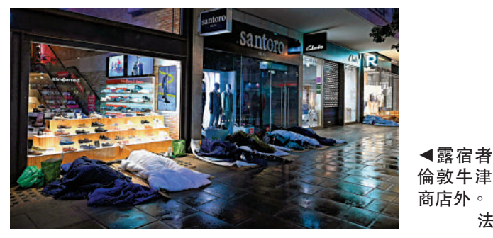
▲露宿者躺在倫敦牛津街的商店外。

去年12月，利茲市議會宣布裁員750人，關閉看護中心和一間音樂廳，並提高停車費和社會護理費；3月5日，伯明翰市議會批准削減3億英鎊（約29.6億港元）開支，並於未來兩年內上調市政稅21%。