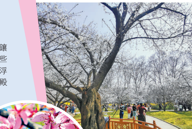
▲武漢多三十年以上樹齡的櫻花，枝幹粗壯。