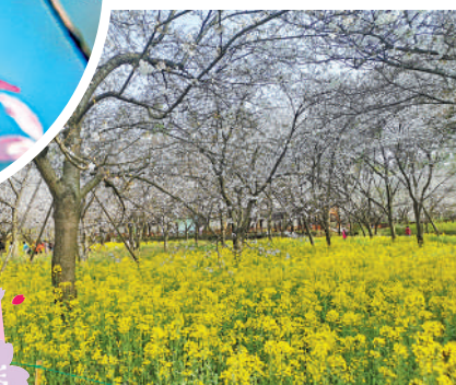
▲櫻花林與成片的油菜花田相映成景。

花在城中，城亦在花中。因為到處有如雲般的櫻花，武漢被網友稱為賞櫻勝地和春天的「天花板」。從新千年開始，武漢就因櫻花成為初代「網紅城市」。大公報記者了解到，截至目前，武漢擁有超50萬株櫻花，全市百株以上的櫻花林共有78處，每個公園幾乎都簇擁花海，是內地名副其實的「櫻花第一城」。