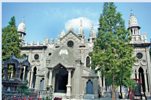
▲古德寺位於武漢江岸區鬧市中。

面闊略大於進深，大殿東南西北各有一門，西向抱出一廂為大門，這些布局均與緬甸阿難陀寺相似，長期以來，人們還習慣地認為古德寺大殿模仿了阿難陀寺大殿的設計。不過，雖然都是塔寺一體，但古德寺大雄寶殿是「寺主塔從」，阿難陀寺則是「塔主寺從」，前者是按照伽藍七堂布局的中國傳統殿堂式建築，後者是一個以塔為主的封閉式建築。