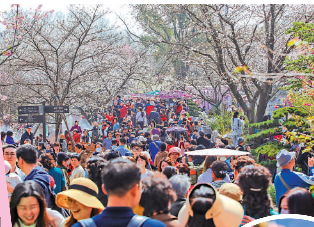
▲在武漢東湖櫻花園，賞櫻花的遊客眾多。