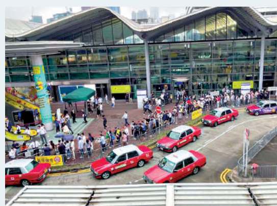
▲Blue Coast排隊人龍延伸至商場外再打蛇餅。