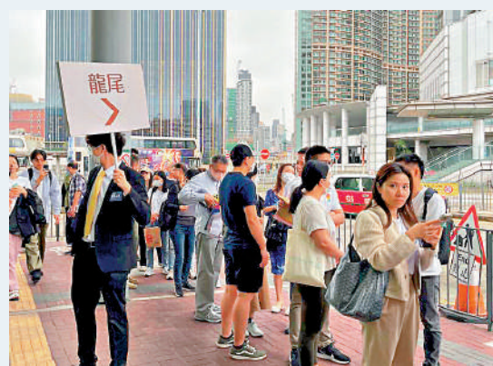
▲長實派出職員在龍尾舉牌提示位置。