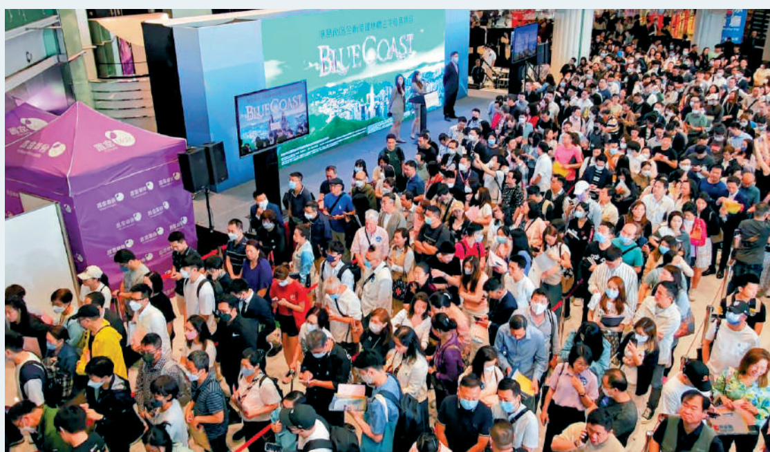
▲Blue Coast首日開賣場面熱鬧，商場迫滿準買家等候揀樓。