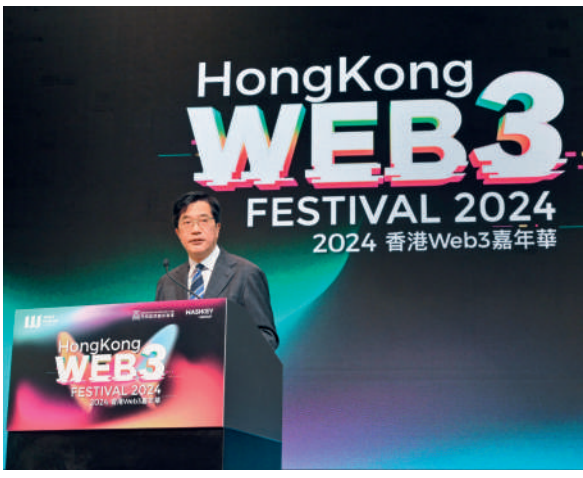
▲財政司副司長黃偉綸表示，全面、明確的監管制度是促進虛擬資產可持續發展的關鍵。

【大公報訊】特區政府於2022年10月發表《有關虛擬資產在港發展的政策宣言》後，去年成立第三代互聯網（Web3.0）發展專責小組，市場關注其發展情況。財政司副司長黃偉綸表示，來自內地、歐美等20多個國家和地區逾220間Web3相關公司，已在港設立辦事處，當中包括虛擬資產交易所、區塊鏈基礎設施公司、區塊鏈網絡安全公司、虛擬貨幣錢包和支付公司。他表示，特區政府會在促進發展和適當監管之間取得平衡，特別是在虛擬資產領域，全面、明確的監管制度是促進虛擬資產可持續發展的關鍵。