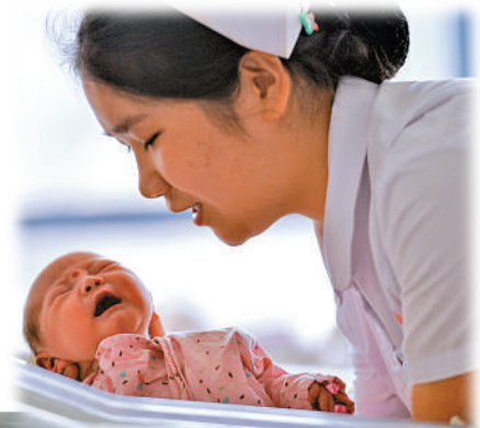
▲在上一輪龍年，也就是2012年壬辰龍年，就出現了龍年嬰兒潮的現象。