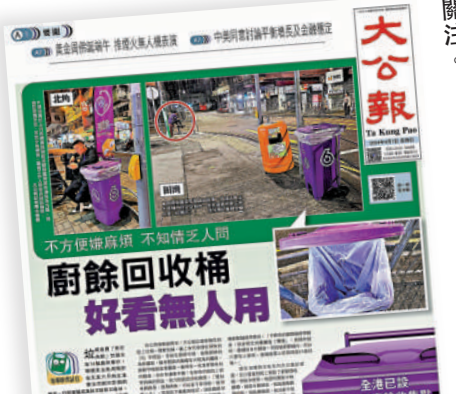
▲《大公報》昨日有關「無人用」的報道，引起社會關注。