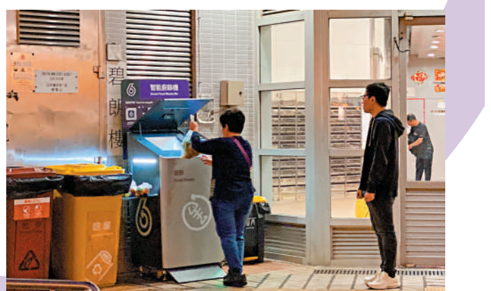
▲政府在各區增設廚餘回收桶，希望增加回收率。市民使用時小心翼翼，避免弄污環境。