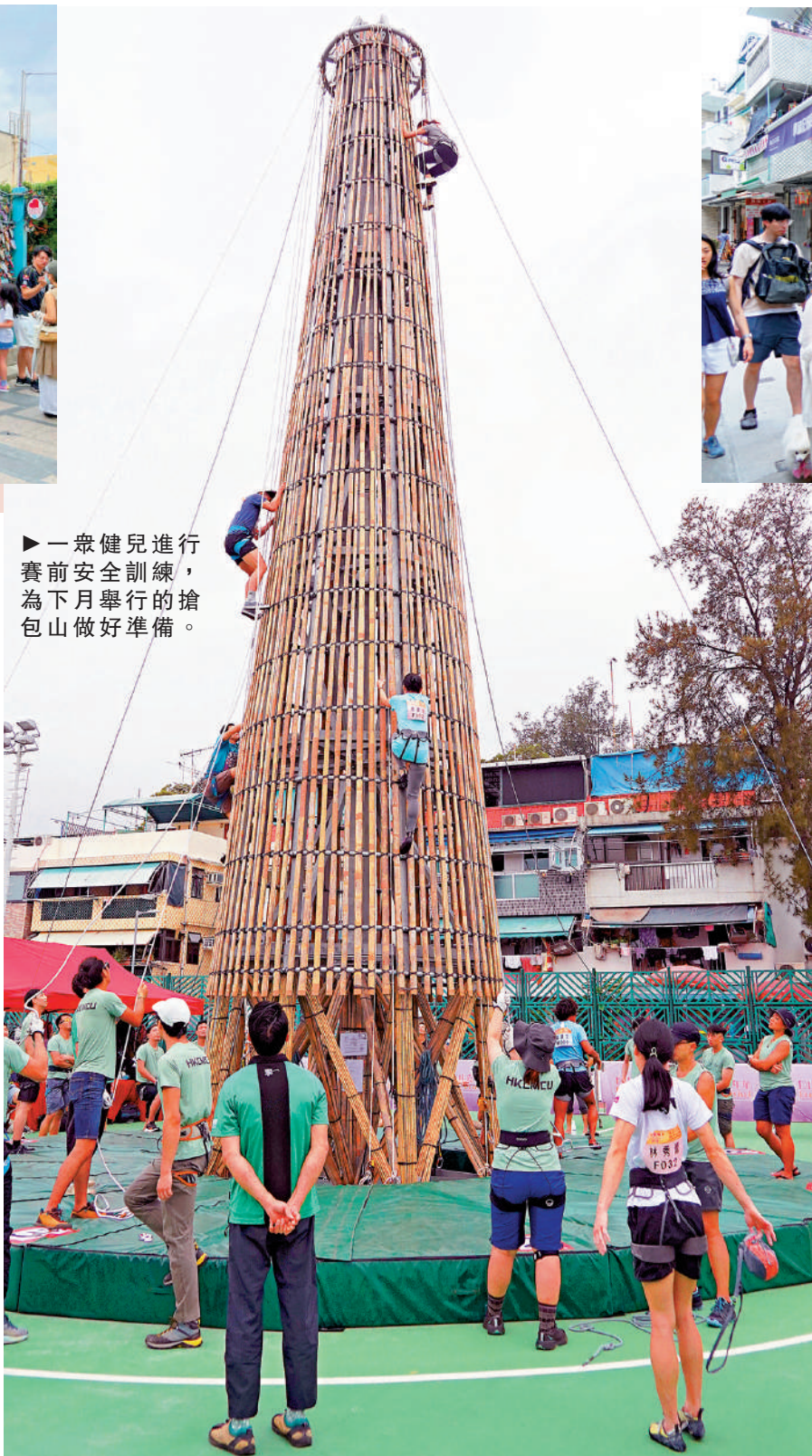
▶一眾健兒進行賽前安全訓練，為下月舉行的搶包山做好準備。