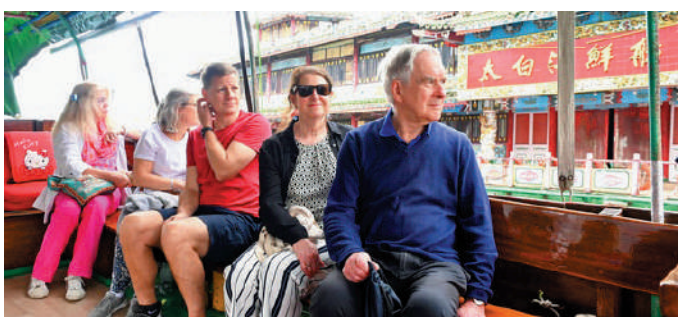
目項◀乘船遊覽避風塘是其中一項饒富香港特色的旅遊項目。