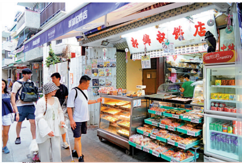
◀長洲不少店舖保持傳統特色，吸引不少年輕遊客前來深度遊。