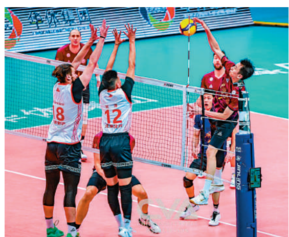
▲上海男排球員（右）網前扣殺。