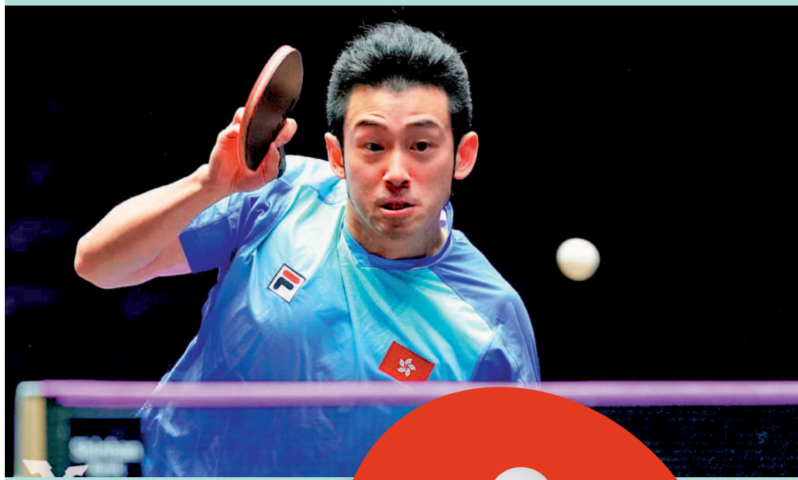
▲黃鎮廷在男單決賽發揮出色。