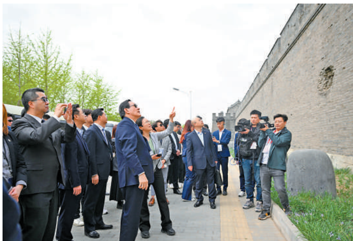
▲馬英九一行8日在北京宛平城外參觀「七七事變」時日軍攻打宛平城留下的彈坑。

【大公報訊】記者朱輝北京報導：74歲的中國國民黨前主席馬英九帶領20位來自寶島台灣青年學子，於4月1日展開「尋根之旅」。在結束了廣東和陝西的訪問行程後，馬英九一行乘坐高鐵於7日下午抵達北京，當日訪問國家大劇院。翌日上午，馬英九參觀中國人民抗日戰爭紀念館和盧溝橋，並與「七七事變」親歷者鄭福來進行了親切互動。據報道，馬英九在參訪完故宮後強調，中華文化源遠流長，任何「去中國化」的行徑都不會成功。