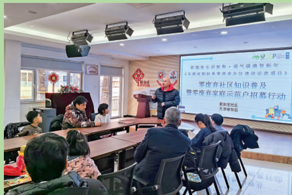
▲社區招募「零廢棄」家庭，打造示範戶。

為了讓更多的居民了解垃圾分類、減量、資源化等環保知識，社區專門組織了一系列的宣傳活動。在這些活動中，居民們學習了如何正確分類垃圾、如何減少垃圾產生、如何將垃圾變廢為寶等知識。許多居民表示，通過這些活動，他們對環保有了更加深刻的認識，也更加明白了垃圾分類、減量、資源化等工作的重要性。