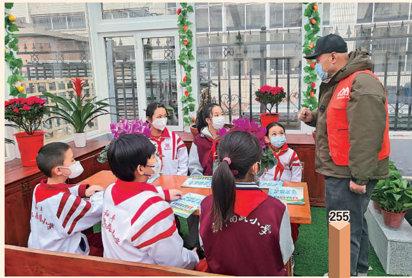
▲社區組織各種形式環保活動，帶動社區居民廣泛參與垃圾分類。