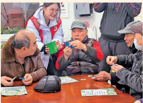
▲社區志願者向居民科普垃圾分類相關知識。

為促進社區可持續發展，倡導零廢棄理念，激發社區居民積極參與零廢棄行動，社區每周會聯合天津綠鄰居社區服務中心開展垃圾分類知識科普、廚餘垃圾堆肥等活動。