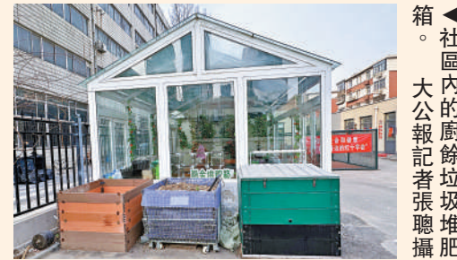
▲社區內的廚餘垃圾堆肥箱。

是一項創新的自願減排機制。利用「互聯網+大數據+碳金融」的方式，具體量化小微企業、社區家庭和個人的節能減碳行為，並賦予一定的價值，建立起以商業激勵、政策鼓勵和核證減排量交易相結合的正向引導機制。「碳賬戶」便是當前碳普惠比較典型的方式之一。